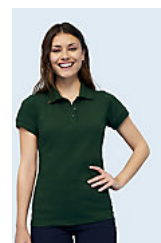
SOL'S PERFECT WOMEN 11347