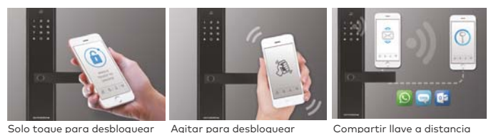
Solo toque para desbloquear Agitar para desbloquear Compartir llave a distancia

Descargue el paquete de instalación de la aplicación