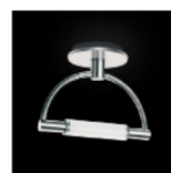
Gradiminisoffitto led tuttopallescete nichel satinato cod 585L