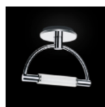
Gradiminisoffitto led tuttopallescete cromo cod 583L