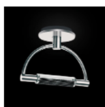
Gradiminisoffitto led retinato nichel satinato cod 520L