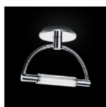
Gradiminisoffitto led opalescente cromo cod 529L