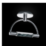
Gradiminisoffitto led retinato cromo cod 518L