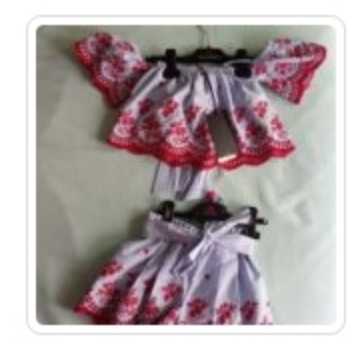
5et Bambina – Due Pezzi – Peuterey – Tg 2 Anni