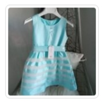
Abito Bambina Cerimonia Carlo – Pignaelli – tg. 5 Anni