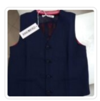
Vestito Bambina - Nina Baby - Tg. 24 Mesi Gilet Bambino - Bikkembergs - Tg. 10 Anni