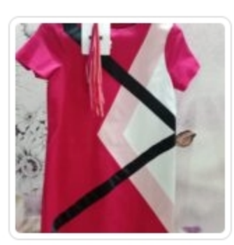
Vestito Bambina- Msgm - Tg. 12 Anni