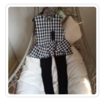
Set Bambina – Due Pezzi – Byblos – Tg. 8 Anni