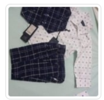
Set Bambino – Tre Pezzi – Manuell & Frank – Tg. 9 Mesi