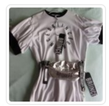
Vestito Bambina - Brince - Tg. 8 Anni