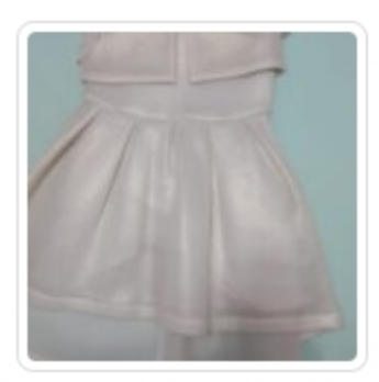
Abito Bambina - Gaialuna - Tg. 4 Anni