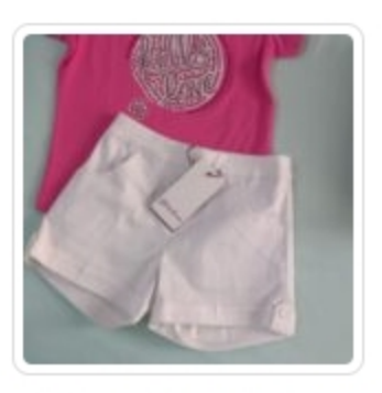
Set due pezzi - Gaialuna - Tg. 36 Mesi