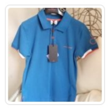
Polo Bambino - Peuterey - Tg. 8 Anni