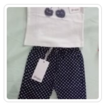
Set Bambina – Due Pezzi – Gaialuna – Tg.12 Mesi