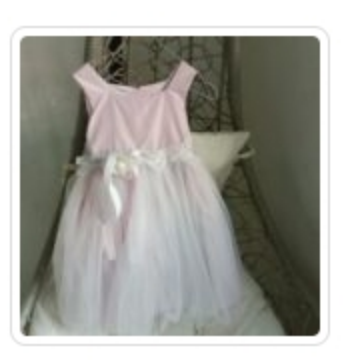
Abito Bambina - Feromoni - Tg. 4 Anni