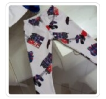
Set Bambina - Tre Pezzi - Byblos