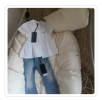
Set Bambina – Due Pezzi – Peuterey – Tg. 2 Anni