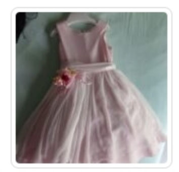
Abito Bambina cerimonia – Ninnaoh – Tg. 5 Anni