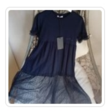
Vestitino Bambina - Peuterey - Tg. 8 Anni