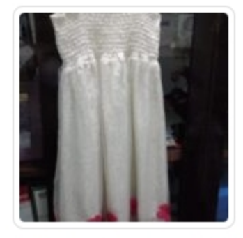
Vestito Bambina - Blumarine - Tg. 10 Anni