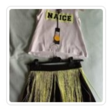
Set Bambina – Due Pezzi – Naice – tg. 8 Anni