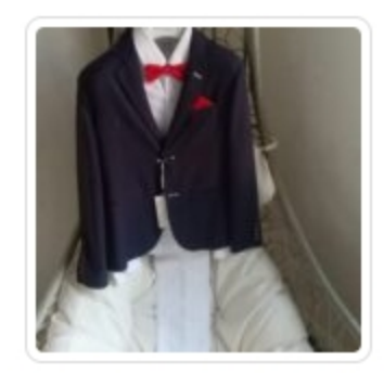
Completo Bambino – Tre Pezzi – Le Perit Dor – Tg. 12 Anni