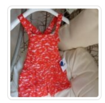
Tuta Bambina - msgm - Tg. 8 Anni