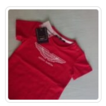
T-shirt - Aston Martin - Tg. 9 mesi