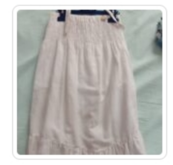
Vestito Bambina – liu jo – Tg.10 anni