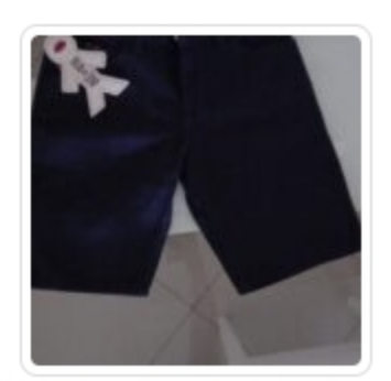
Pantaloncino – Bambino – Rare – Tg. 8 anni