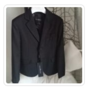
Giacca - Richmond - Tg. 8 Ann