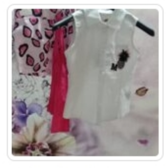
Set Bambina – Due Pezzi – msgm – Tg. 8 Anni