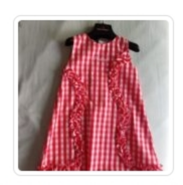
Vestito Bambina – Peuterey – Tg. 2 anni