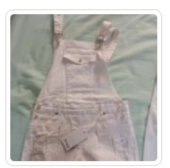
Salopette Bambina – Gaialuna – Tg. 10 Anni