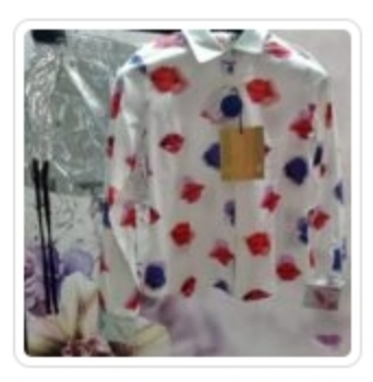
Bretagna Due - Pezzi - Msgm - Tg. 8 Anni Set Bambina - Due Pezzi - Peuterey - Tg 2 Abito Bambina Cerimonia Carlo - Pignaelli