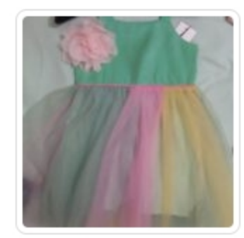
Abito Bambina - Ninnaoh - Tg. 4 anni