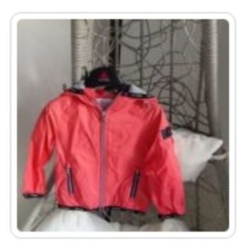
Giubbino Bambino - Peuterey - Tg. 2 Anni