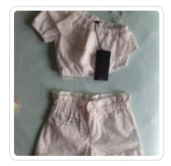
Set Bambina – Due Pezzi – Peuterey – tg. 2 Anni