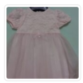
Vestito Bambina – Ninnaoh – Tg.12 Mesi