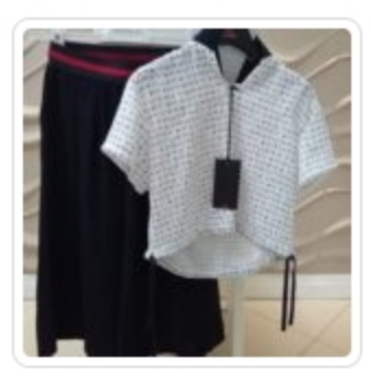
Set Bambina – Due Pezzi – Peuterey – Tg. 8 Anni