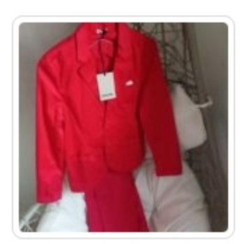
Vestito Bambina - Ronnie key - Tg.10 anni