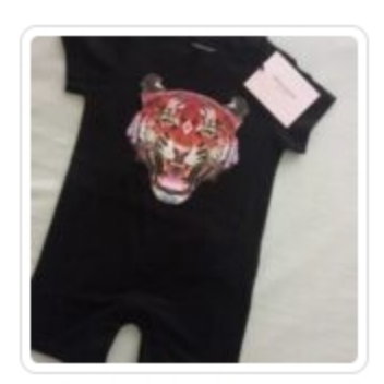
Tutina - Marcello Burlon - Tg. 9 mesi