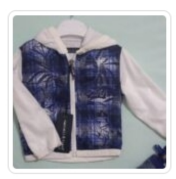
Giubbotto Bambino – Riders – Tg. 6 Anni