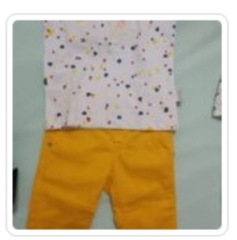
Completo Bambino – Due Pezzi – Manuell & Frank – Tg. 9 Mesi