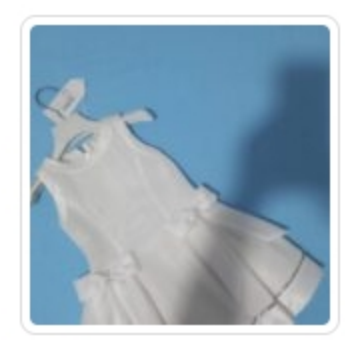
Abito Bambina - Ninnaoh - Tg. 3 Anni