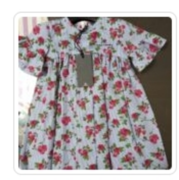
Vestito Bambina – Ninnaoh – Tg. 12 Mesi