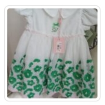
Vestito Bambina – Blumarine – Tg. 12 Mesi