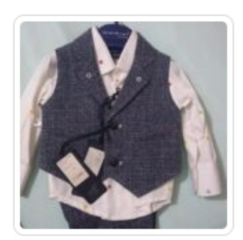
Set Bambino – Tre Pezzi – Manuell & Frank Vestitino Bambina – Gaialuna – Tg. 12 Mesi - Tg. 9 Mesi