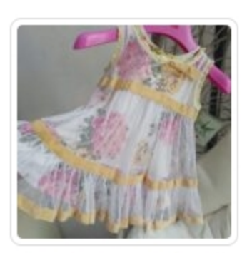
Vestito Bambina – Monnalisa – Tg. 2 Anni