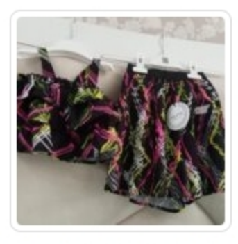
Set Bambina – Due Pezzi – Akita – Tg. 18 Mesi