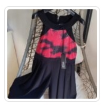
Tuta Bambina - Naice - Tg. 8 Anni