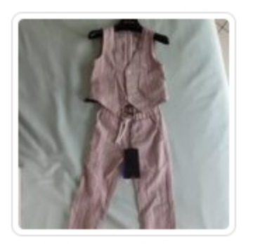
Set Bambino – Due Pezzi – Peuterey – Tg. 2 Anni