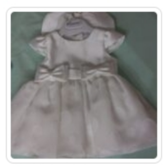
Vestito Bambina – Ninnaoh – Tg.12 Mesi