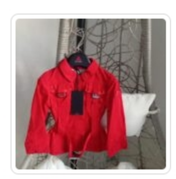
Giubbino Bambina - Puterey - Tg. 2 Anni