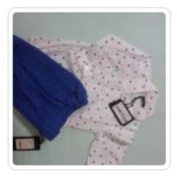
Set Bambino - Due Pezzi - Manuell & Frank - Tg.9 Mesi