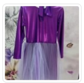
Vestito Bambina - La Nina - Tg. 8 Anni