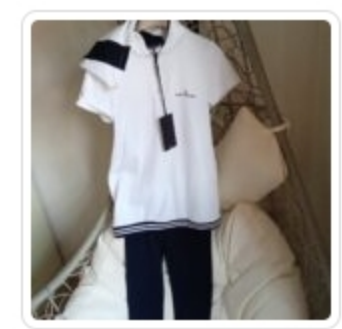
Completo Bambina – Due Pezzi – Peuterey – Tg.8 Anni