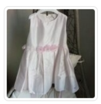
Abito Bambina Cerimonia – Fun & Fun – Tg. 4 Anni