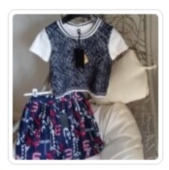
Tuta Bambina - Msgm - Tg. 8 Anni