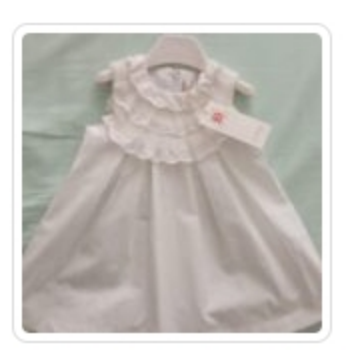
Vestitino Bambina – Laura Biagiotti – Tg.12 Mesi