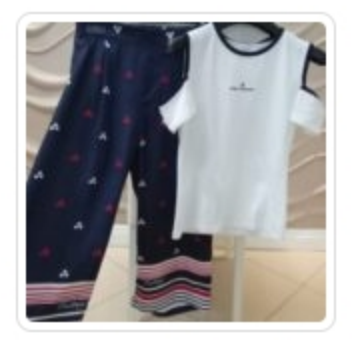
Set Bambina – Due Pezzi – Peuterey – Tg 8 anni