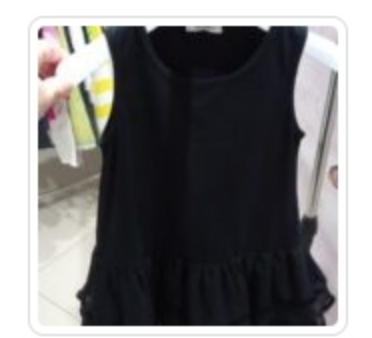
Vestito Bambina - Byblos -Tg. 3 Anni