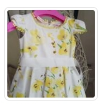
Vestitino Bambina - Blumarine - Tg. 12 Mesi