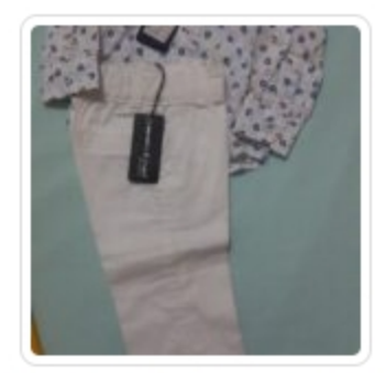
Completo Bambino - Due Pezzi - Manuell & Frank - Tg. 9 Mesi