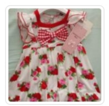
Vestitino Bambina – Monnalisa – Tg. 12 Mesi