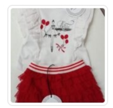
Set Bambina – Due Pezzi – Akita – Tg.12 Mesi