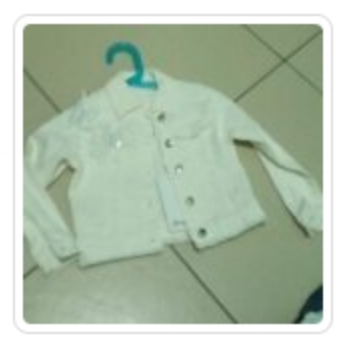
Giubbino Bambina - Gaialuna - Tg. 2 Anni