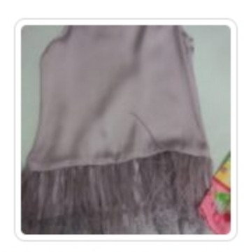
Vestito Bambina - Byblos - Tg. 3 Anni