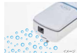
本体上部からマイナスイオンが放出し続けます。

オゾン発生は、厚生労働省が定める安全基準値の1/100(0.001ppm)以下の測定結果です。