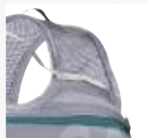
SUJETADOR DE CASCO