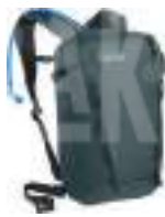
2531001000 DARK SLATE : BLACK