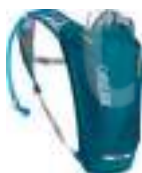
2952402000 MOROCCAN BLUE