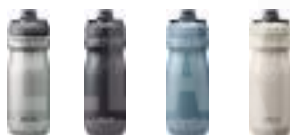
2964102052 STAINLESS 2964001052 BLACK 2964401052 PACIFIC 2964201052 STONE