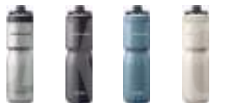
2965102065 STAINLESS 2965001065 BLACK 2965401065 PACIFIC 2965201065 STONE