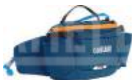
2815401000 GIBRALTAR NAVY : ORANGE