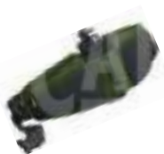
2526301000 ARMY GREEN : BLACK