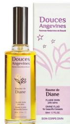
DOUCE ANGEVINES, baume de Diane

Flacon pompe de 50 ml – 47 € Disponible en magasins bio et sur le site douceangevines.com