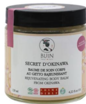
BIJIN, baume de soin corps au getto rajeunissant

Pot de 120 ml – 39 € Disponible en magasins bio, pharmacies et concept-stores et sur bijin-shop.com