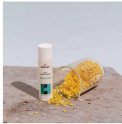
MATIERE BRUTE, soin des lèvres hydratant Hiver