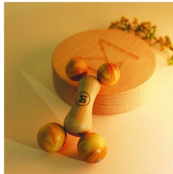
MATIERE BRUTE, boulado

Le masseur – 19 € En vente sur l'eshop : matierebrutelab.com