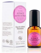
ELIXIRS & CO, eau de toilette «Audace»

Flacon de 30 ml – 19,50 € Disponible sur lesfleursdebach.com , dans les boutiques Elixirs & Co