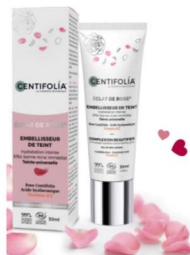
CENTIFOLIA, embellisseur de teint

Un embellisseur de teint surdoué et 2 en 1 pour une hydratation intense et un effet bonne mine immédiat. Au cœur des formules, un actif phare, la Rose Centifolia, ainsi que de la vitamine C et de l'acide hyaluronique. Sa texture légère non couvrante et sa teinte rose universelle rehausse le teint pour un effet bonne mine immédiat et naturel, parfait pour séduire toute la nuit sans en faire trop ! Tube de 30 ml – 19,50 € Disponible en magasins bio, en pharmacies, parapharmacies et sur le site centifoliabio.fr