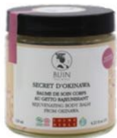
Pot de 120 ml - 39 €

Disponible en magasins bio, pharmacies et concept-stores et sur bijin-shop.com