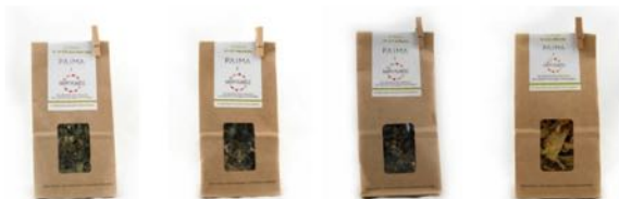
La tisane des peaux matures Sachet de 25 g - 8,90 €

Disponibles en magasins bio, instituts de beauté et sur le site paima-beaute.com