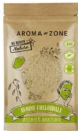
Sachet kraft de 50 g - 3,50 €

Disponible dans les boutiques AROMA-ZONE et sur aroma-zone.com