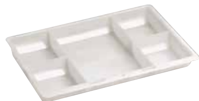
Einsatz 3-17 (außer 14)