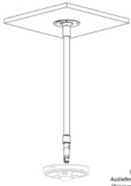
Beispiel / Example Auslieferung ohne Kamera Shipment without camera