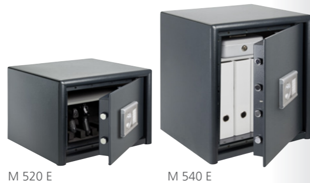
M 520 E