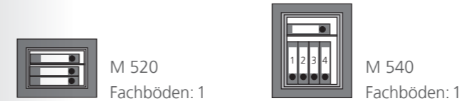
M 520 Fachböden: 1