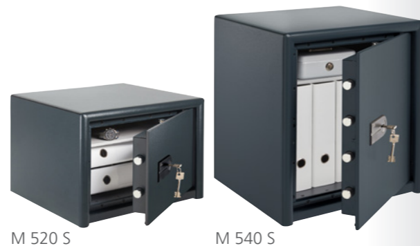
M 520 S