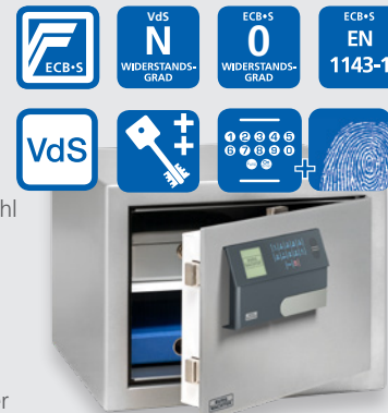
Karat MT 640 E FP