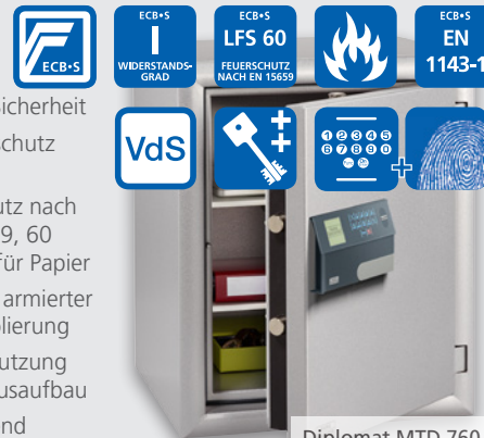
Diplomat MTD 760 E FP