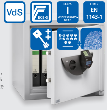
Office-Line OL 811 E FP