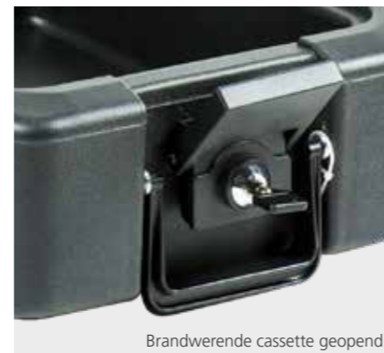
Brandwerende cassette geopend

Voor nog meer volume: de brandwerende kluis FP 44 E (zie pagina 277)