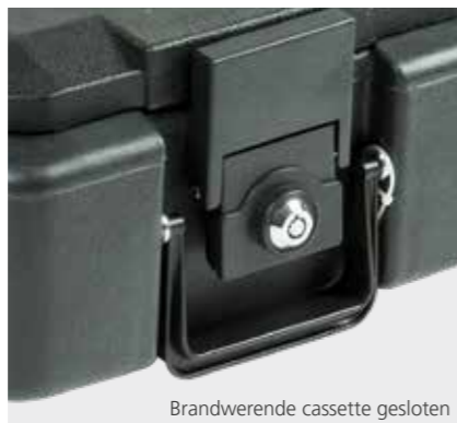
Brandwerende cassette gesloten