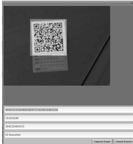
Abb.2: QR-Code Scan