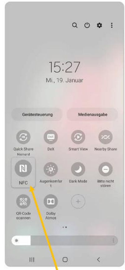
3. Tippe auf das NFC-Symbol, um die Funktion ein-/ oder auszuschalten.