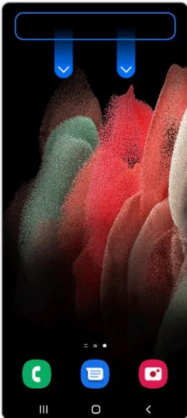
1. Wische auf dem Bildschirm mit zwei Fingern nach unten, um die Schnelleinstellungsleiste aufzurufen.

Du kannst die NFC Funktion deines Handys schnell und unkompliziert einschalten.