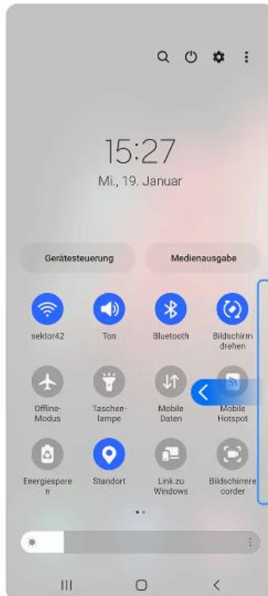
2. Wische mit einem Finger nach links, um dir weitere Schaltflächen anzeigen zu lassen.