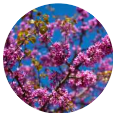
PALO DE ARCO