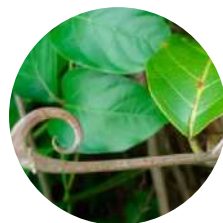
UÑA DE GATO