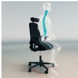
Sitta i balans