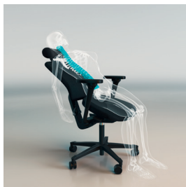
Sträcka ut kroppen