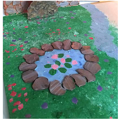
Wenn die Farbe getrocknet ist, mit einem Wattestäbchen oder dünnem Pinsel bunte Farbtupfer als Blumen verteilen.