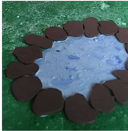
Die Farben nebeneinander auf das Schwämmchen auftragen und einfach lostupfen.