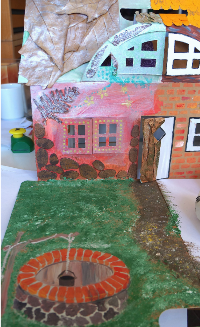
Schritt 9: Auf dem Rasen hast du Platz für einen Teich, Brunnen, Spielplatz, Baum, Zaun, vielleicht auch eine kleine Bank zum Ausruhen....