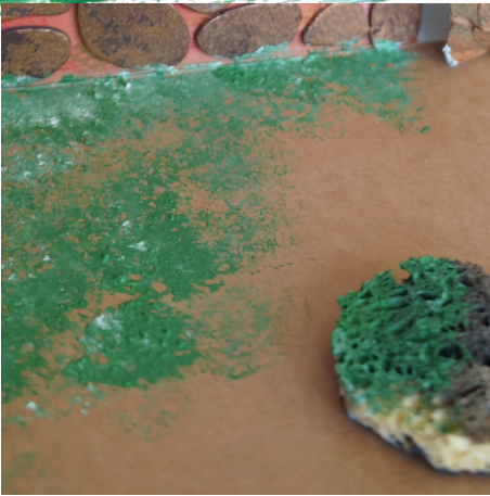
Schritt 8: Den Rasen kannst du mit einem Schwämmchen auf tupfen. Hierfür brauchst du Grün und ein wenig Weiß als Grundierung.