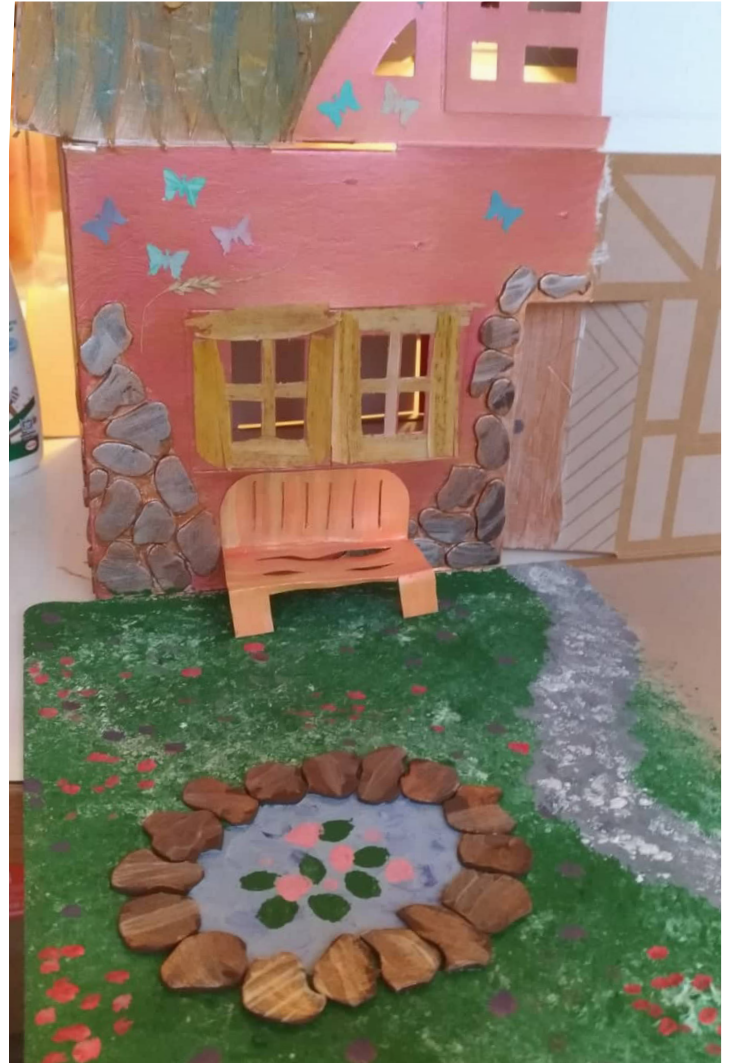
Zeig uns Deine Kreation! Poste ein Foto mit #meinpappka