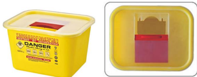
Reference : REAL-F4 (capacité 3.7L)