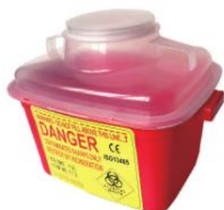
Reference : REAL-F13 (capacité 12.5L)