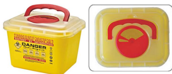
Reference : REAL-F5A (capacité 4.7L)