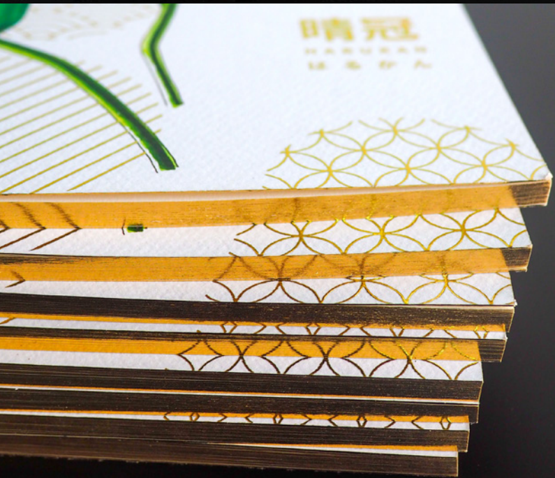
Quaderno Universo 80 pagine Dettagli