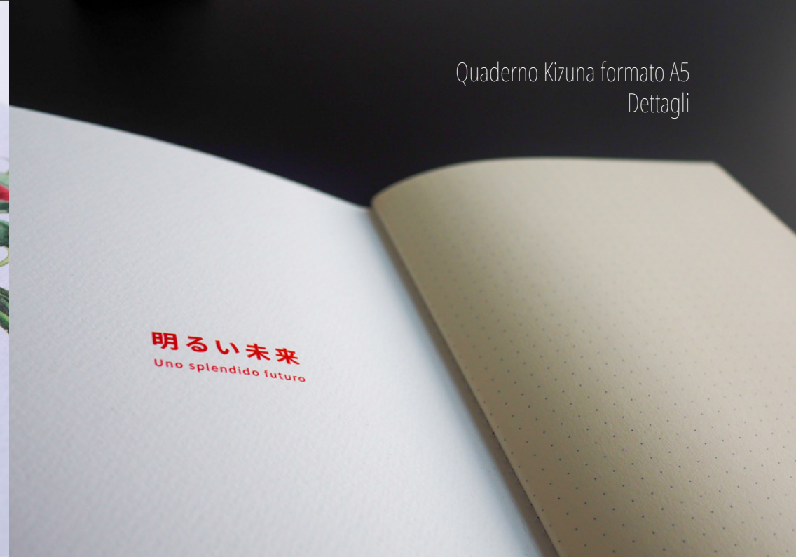
Quaderno Kizuna formato A5 Dettagli