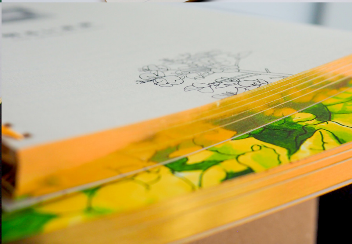
Agenda Universo Dettagli