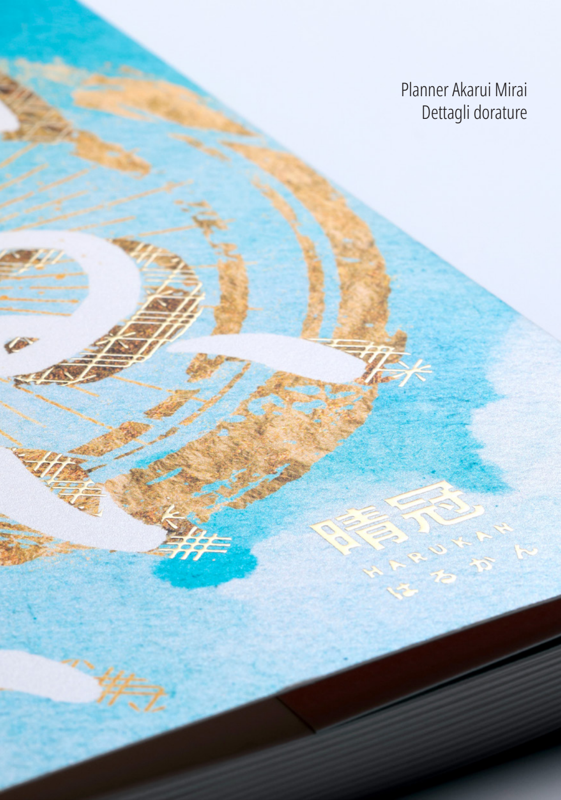
Planner Akarui Mirai Dettagli dorature