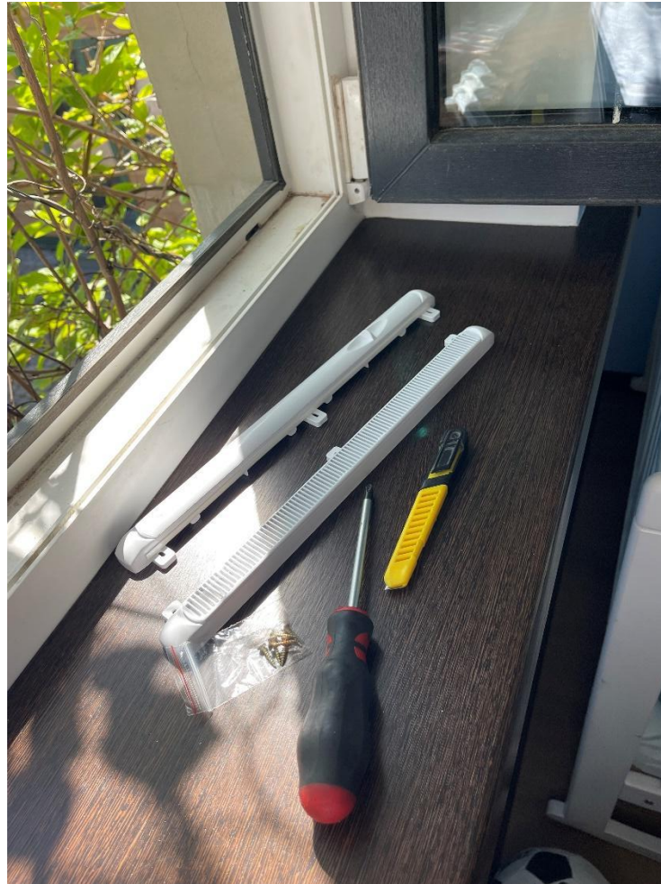
Solis 1 - Atvērt logu