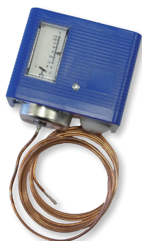
LxAxH (mm): 85 x 125 x 58

Termostato ajustable, de aplicación en superficie 230V-50Hz. IP54. Puede ser instalado en el exterior. Intensidad máxima 4A (inductiva). Rango de temperatura de 0°C a +40°C. Diferencial de \pm 0,75 K.