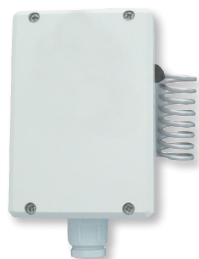
LxAxH (mm): 86 x 80 x 50