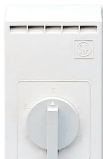
LxAxH (mm): 90 x 54 x 134