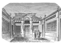
La fabrique de la rue d'Hauteville, dans le 10ème arrondissement de Paris, à la fin du XIXème