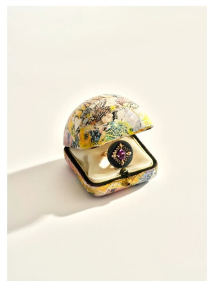
Un écrin vintage, customisé par l'artiste Senz, accueille une bague ornée d'une rhodolite.