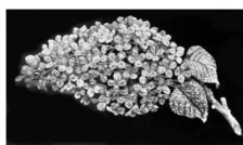
La broche Lilas, achetée par l'Impératrice Eugénie chez Rouvenat.

», assure Marc Bascou, conservateur général honoraire du patrimoine, qui s'est penché sur la question. Qui se souvient encore de ses ateliers, gigantesques, de la rue d'Hauteville, dans le dixième arrondissement, ses prix décrochés aux expositions internationales, qu'il connaissait bien pour avoir exposé lors de la toute première organisée à Londres en 1851, participant à la création du « Pavillon de la Joaillerie » ? C'est suite à ce succès qu'il ouvre ses ateliers parisiens où se pressent les clientes - dont l'Impératrice Eugénie, grande amatrice de joaillerie - qui commande en 1867 à Paris l'une de ses plus belles broches, une branche de lilas frais, sertie de 300 diamants.