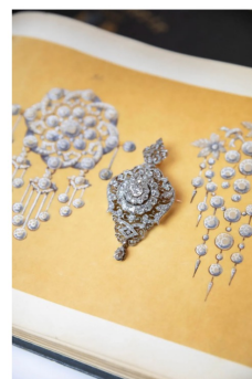
Ce bijou Rouvenat, resté pendant sept générations dans la même famille, incarne déjà les formes rondes du Rouvenat d'aujourd'hui.