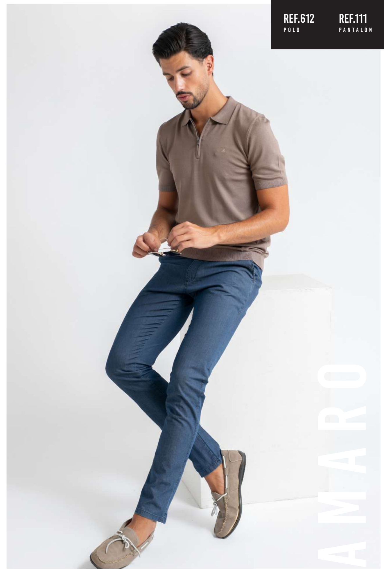
REF.612 POLO REF.111 PANTALÓN