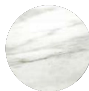
Marbre de Carrare Carrara marble