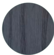
Frêne teinté noir Black ash