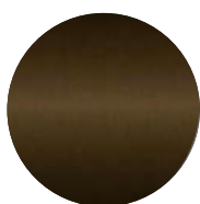
Bronze noir Black bronze