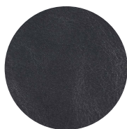
Cuir pleine fleur noire Full grain black leather