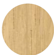
Chêne massif verni Black solid ash