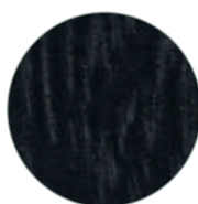
Frêne massif noir Black solid ash