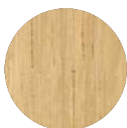
Chêne massif verni Black solid ash