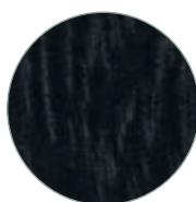
Frêne massif noir Black solid ash