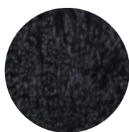
Peau de chèvre de Mongolie noire Black Mongolian goatskin