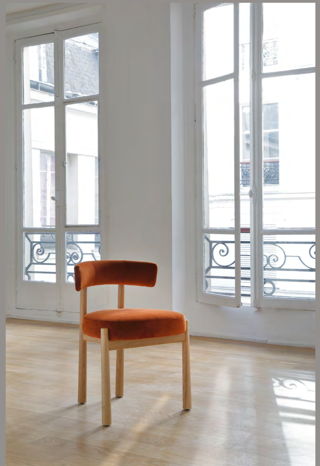
DALYA - PA19 By Patricia Urquiola 2022