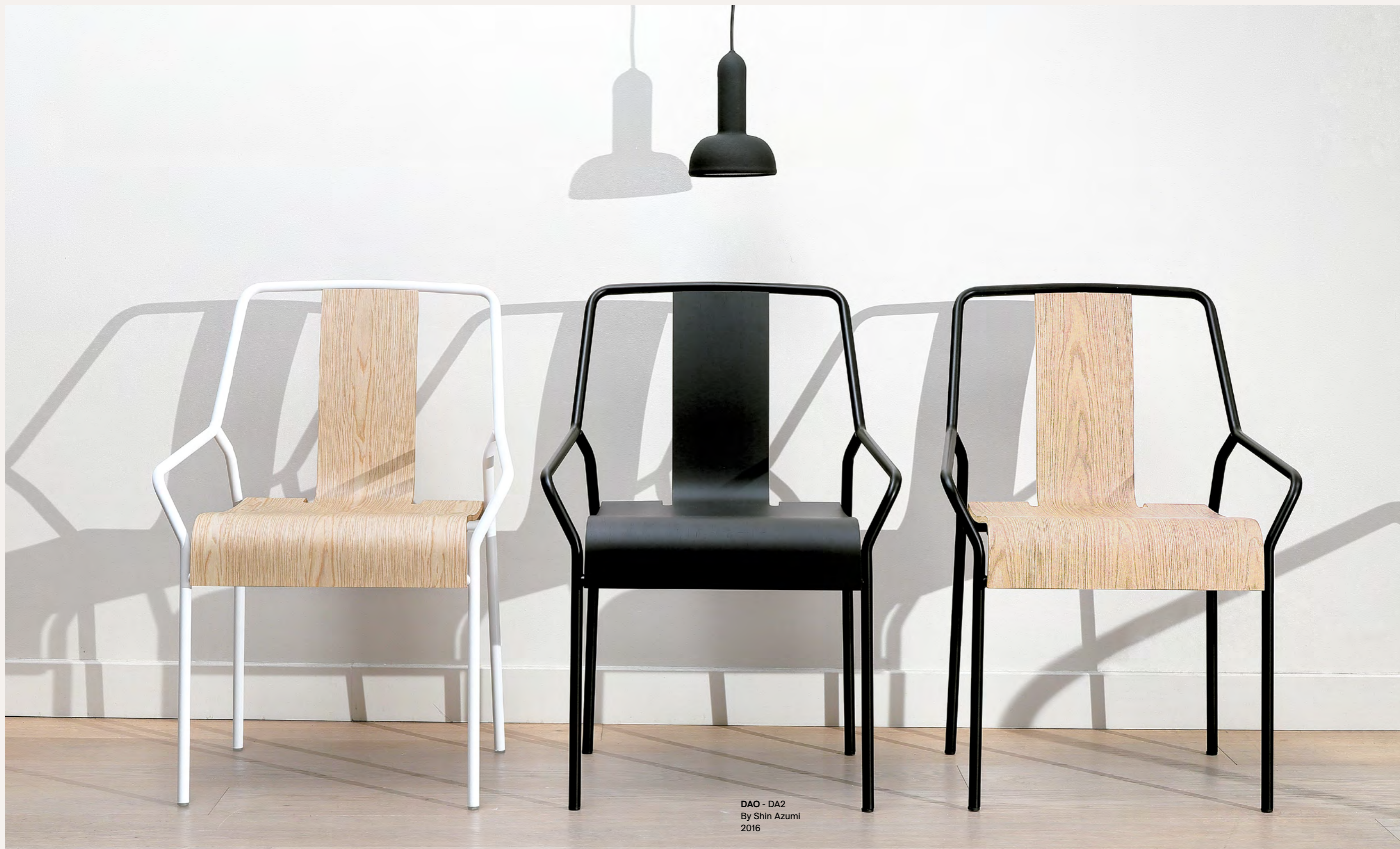
DAO - DA2 By Shin Azumi 2016

The DAO chair has a structure in black lacquered metal and a backrest in natural oak veneer or stained black, or upholstered version. It is ergonomic, comfortable and stackable. This model DAO exists in high stool version.