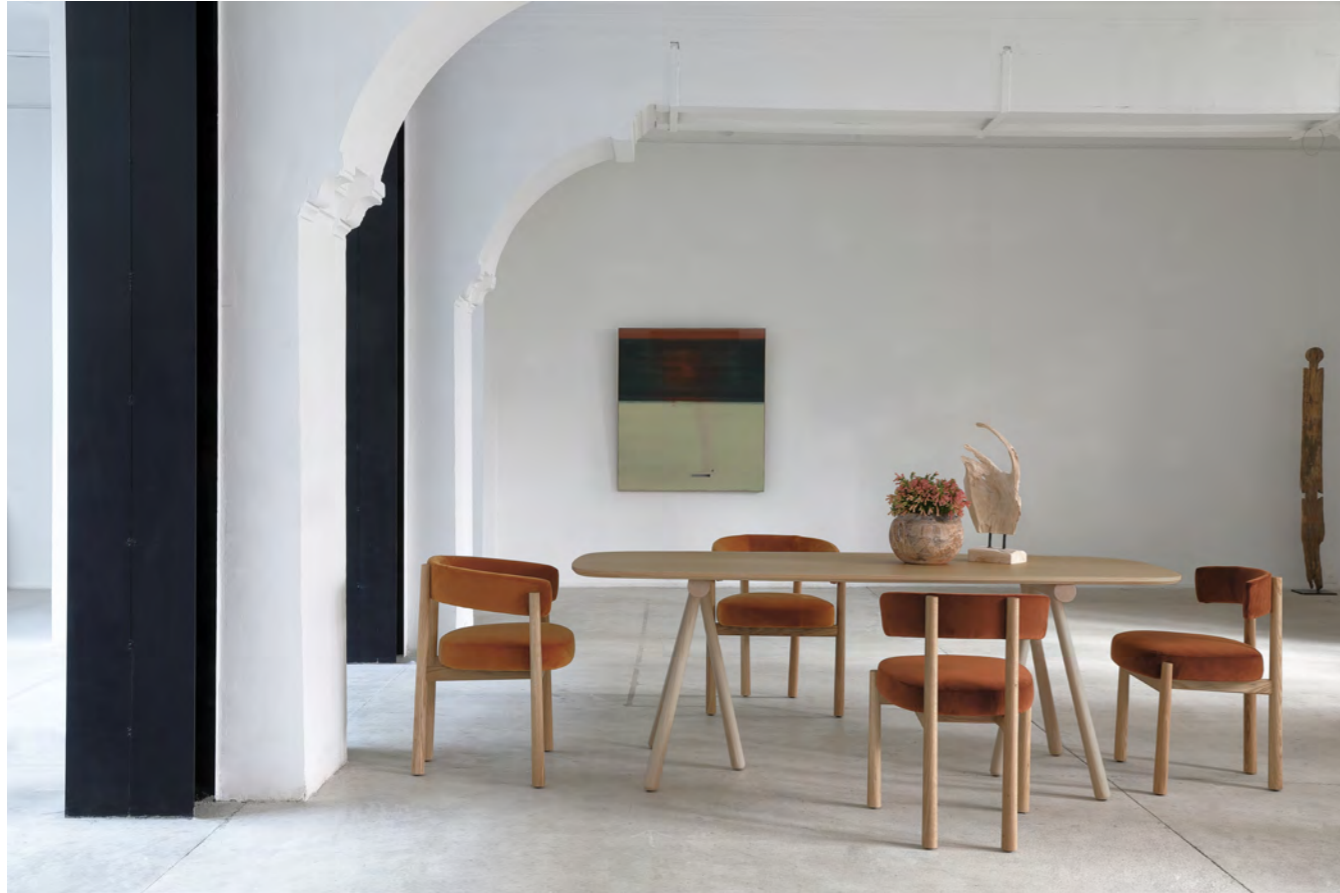
ALTAY - PA7 By Patricia Urquiola 2016