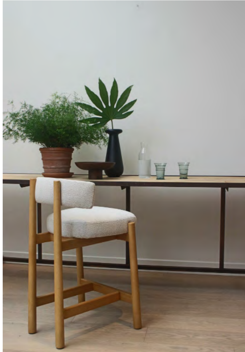
DALYA - PA23 By Patricia Urquiola 2023