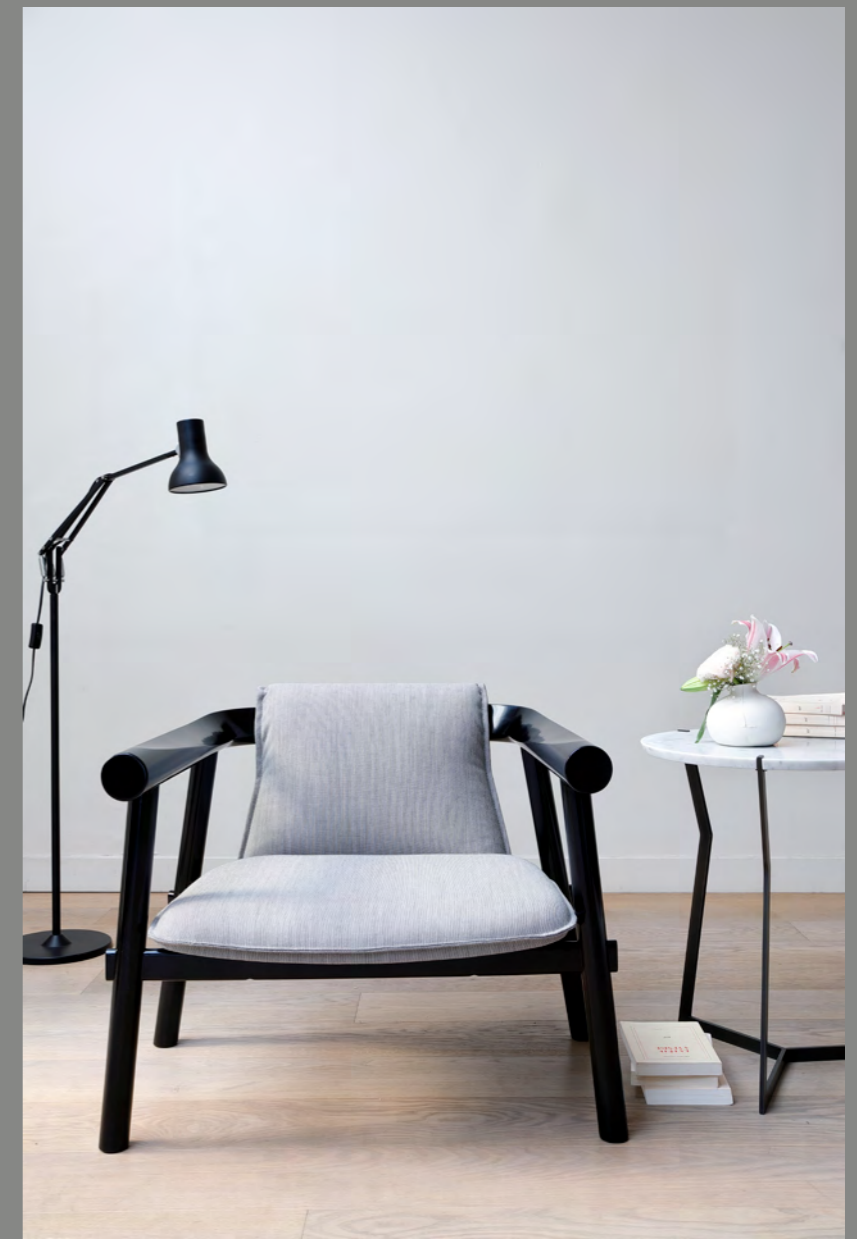
ALTAY - PA100 By Patricia Urquiola 2015