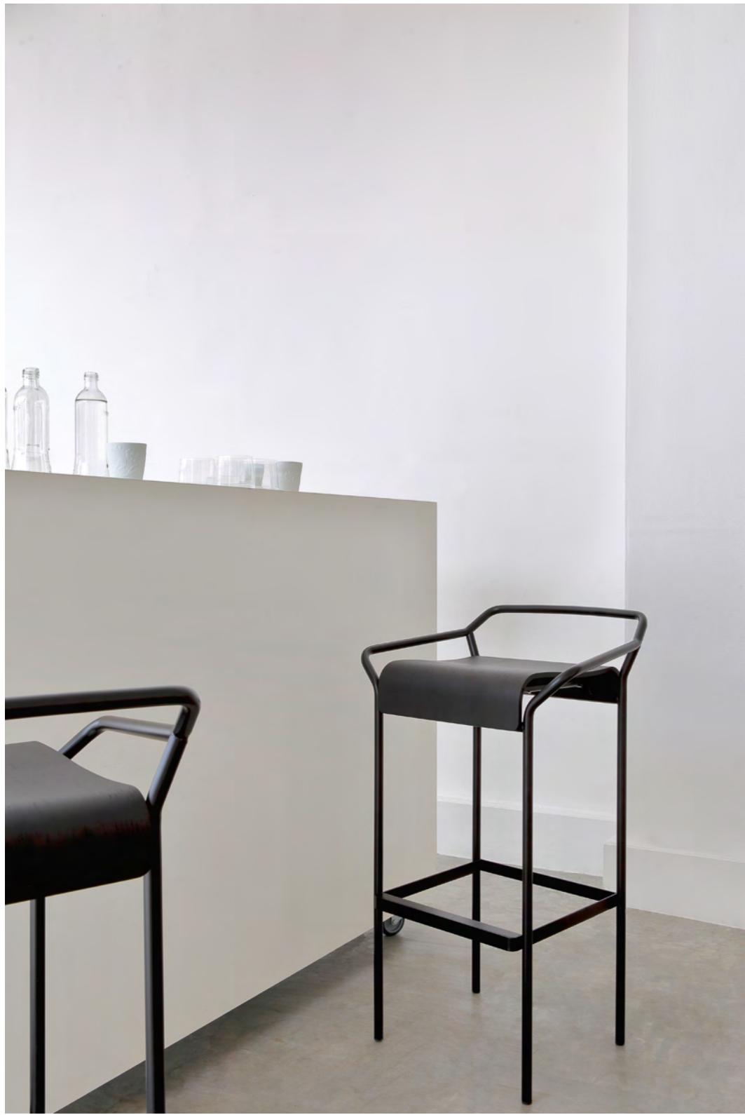
DAO - DA3 By Shin Azumi 2017