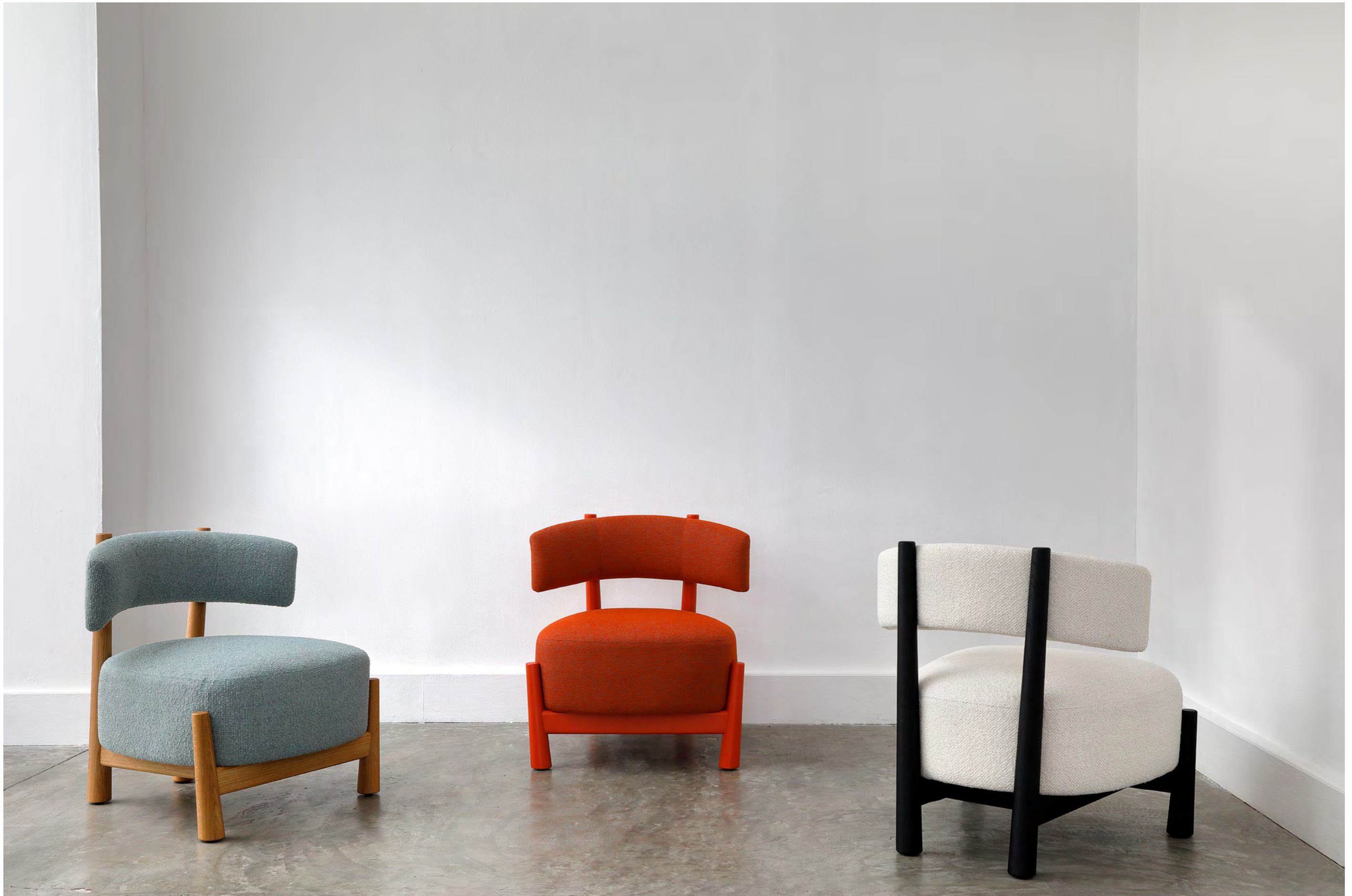
DALYA - PA18 By Patricia Urquiola 2020/2021