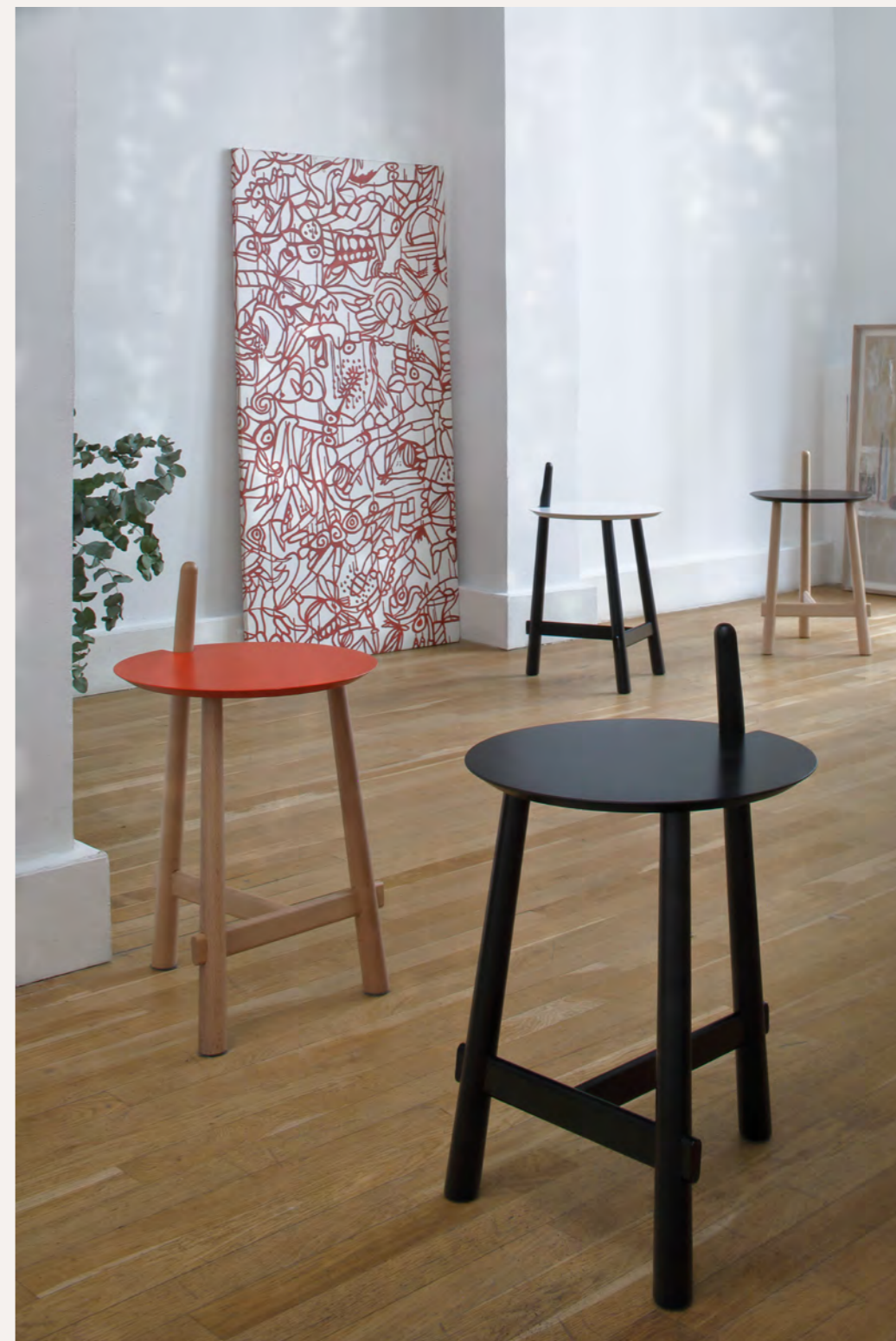
ALTAY - PA4 By Patricia Urquiola 2006