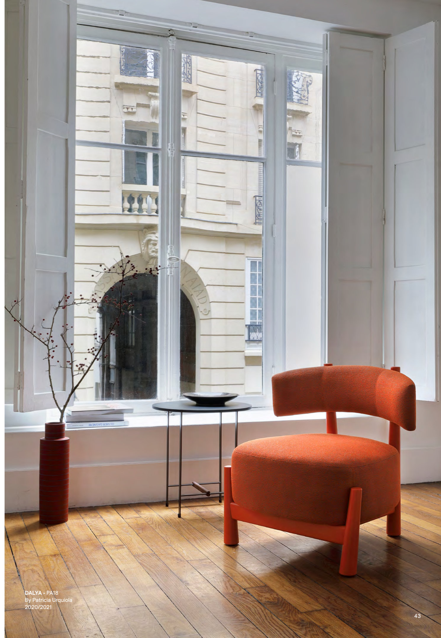
DALYA - PA18 By Patricia Urquiola 2020/2021