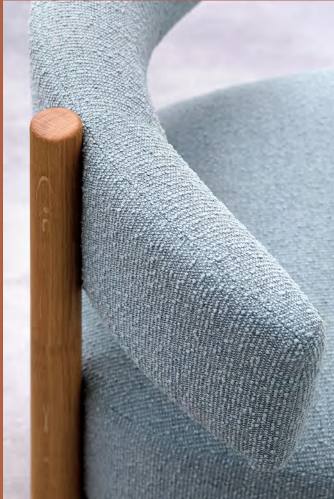
DALYA - PA18 By Patricia Urquiola 2020/2021