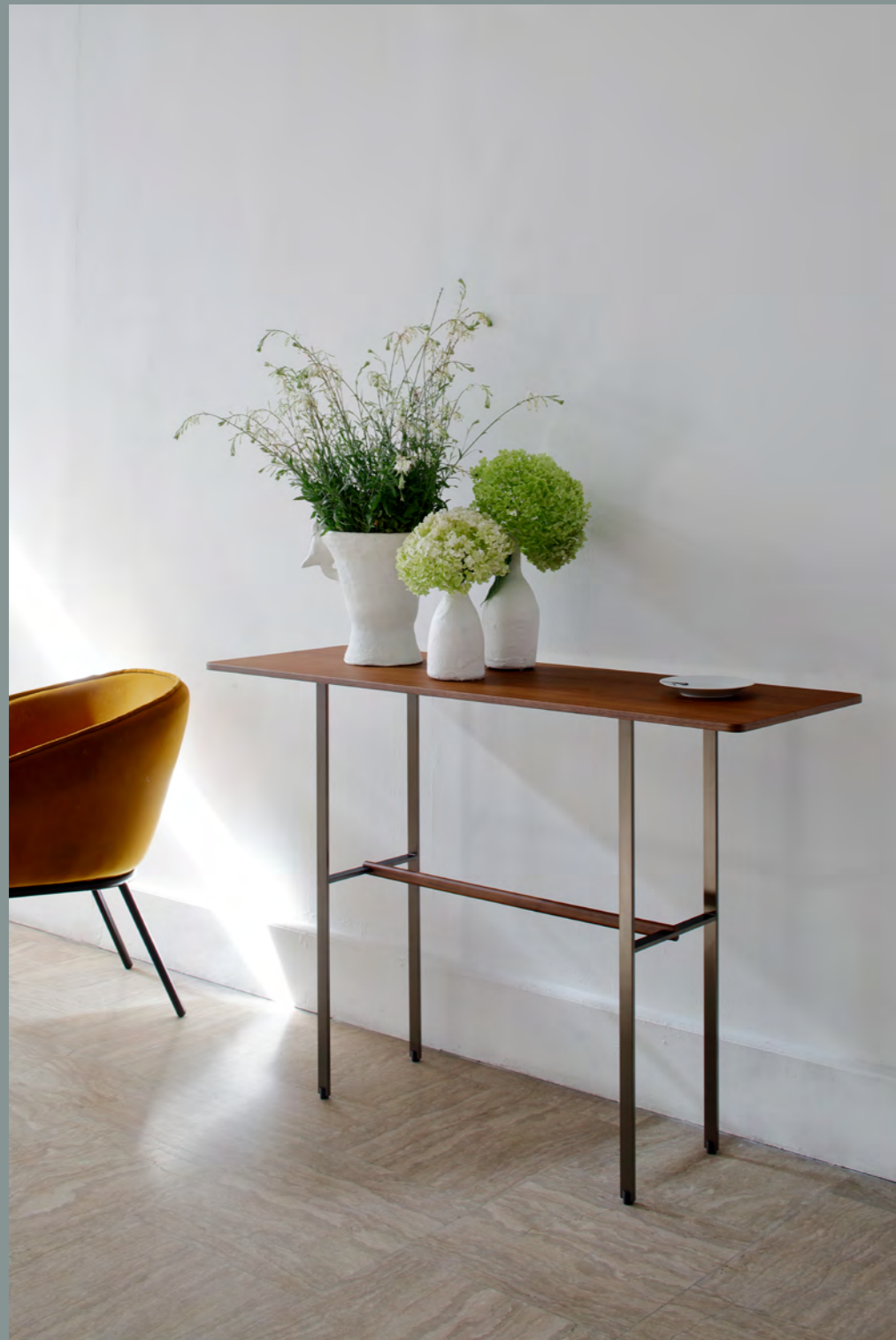
SISTERS - PA17 By Patricia Urquiola 2020/2021