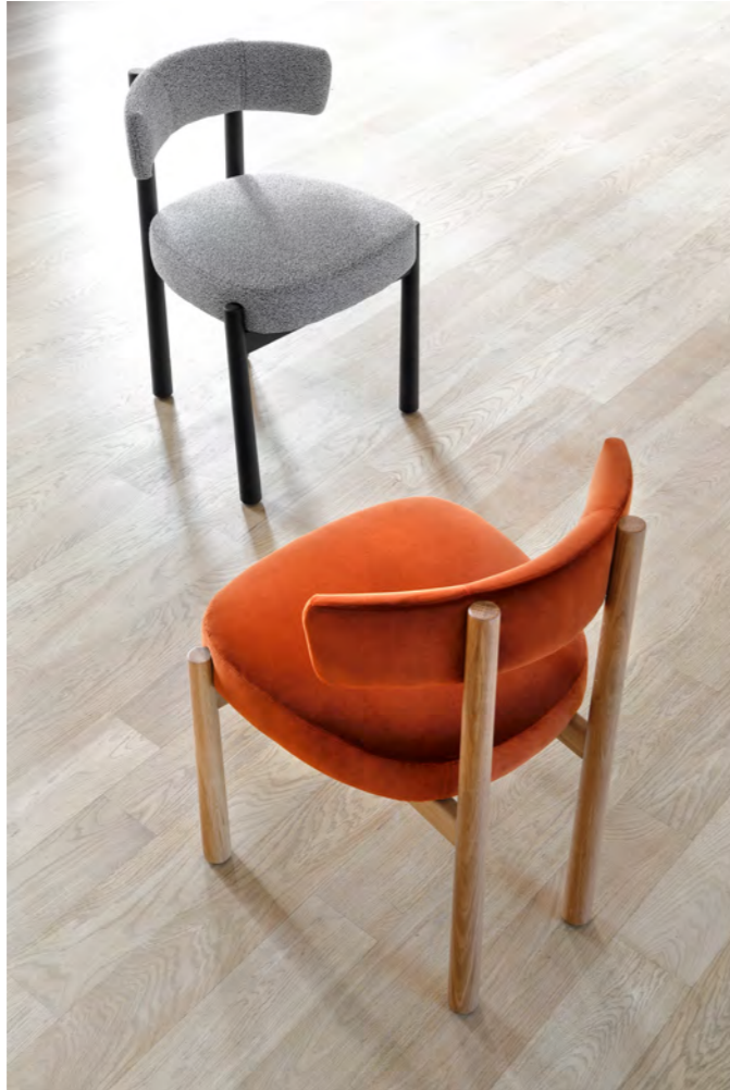
DALYA - PA19 By Patricia Urquiola 2022