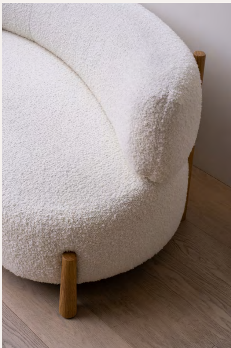
DALYA - PA22 By Patricia Urquiola 2023

The "Dalya" collection, by Patricia Urquiola, illustrious designer, is completed by a sofa and an armchair, with rounded shapes, elegant, comfortable, not following the trends, linked to the quality of the selected foams, and produced by factories respecting the sustainability. 2 barstools complete this range.