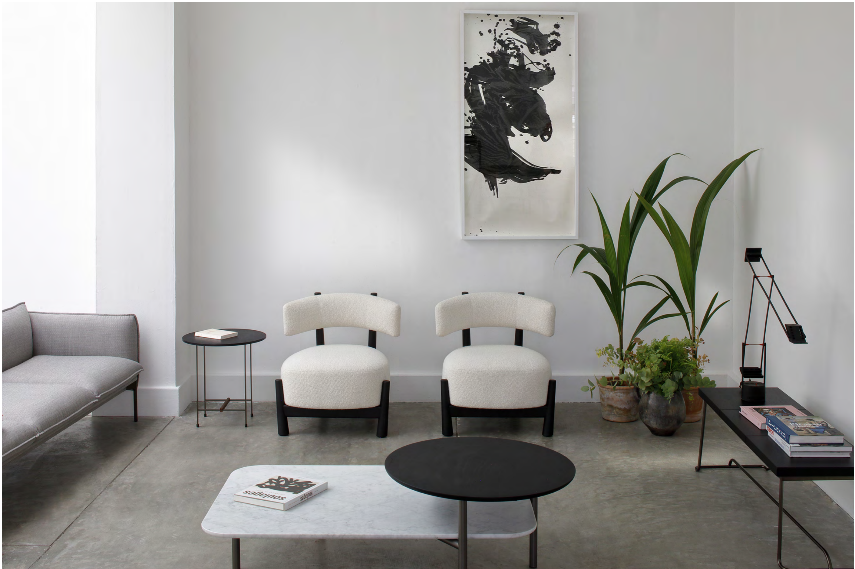
PALM SPRINGS - AV3 By Anderssen & Voll 2020/2021