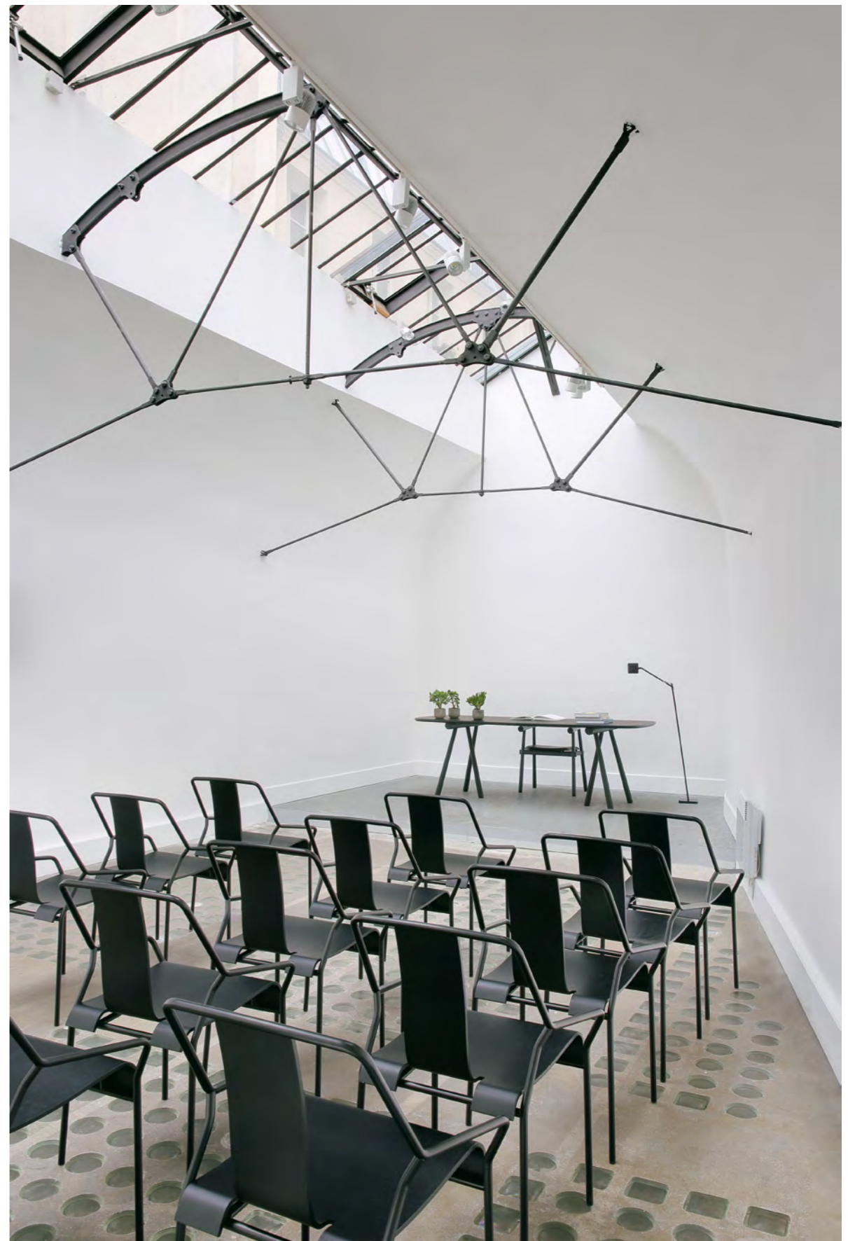
DAO - DA2 By Shin Azumi 2018