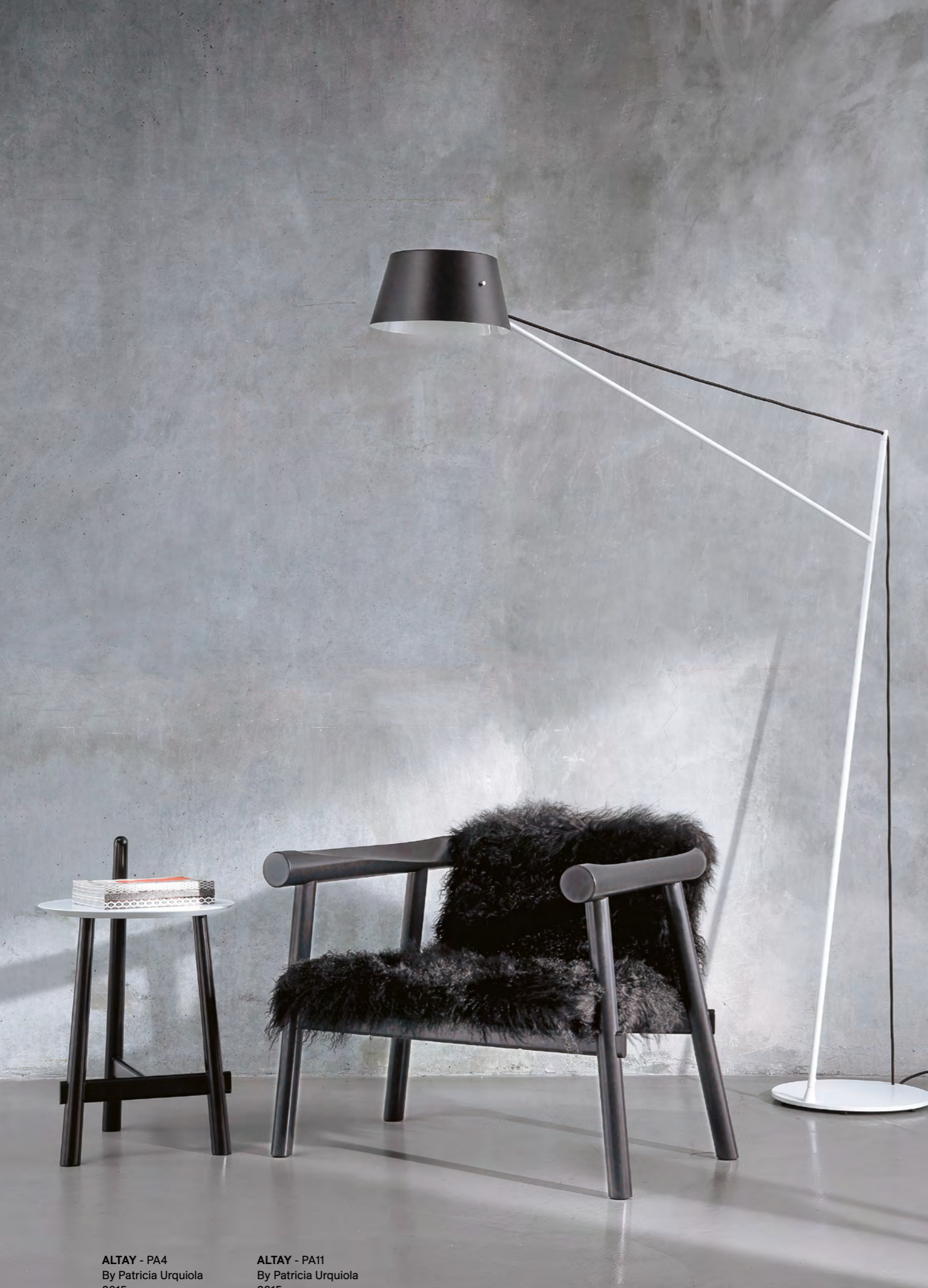
ALTAY - PA4 By Patricia Urquiola 2015