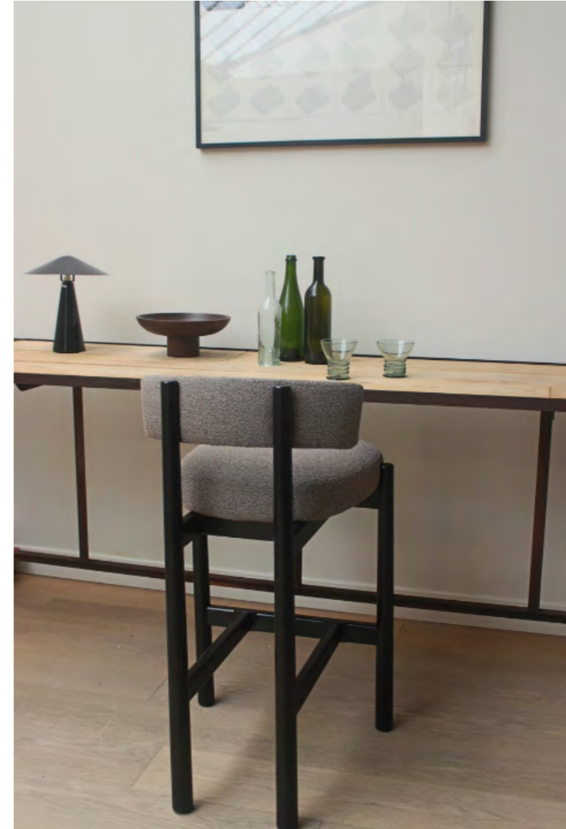
DALYA - PA24 By Patricia Urquiola 2023