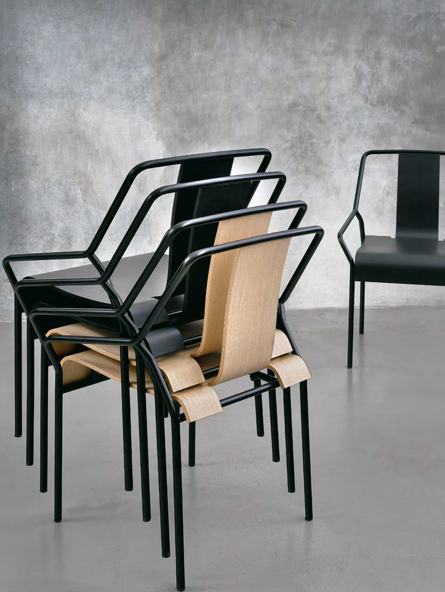
DAO - DA2 By Shin Azumi 2018