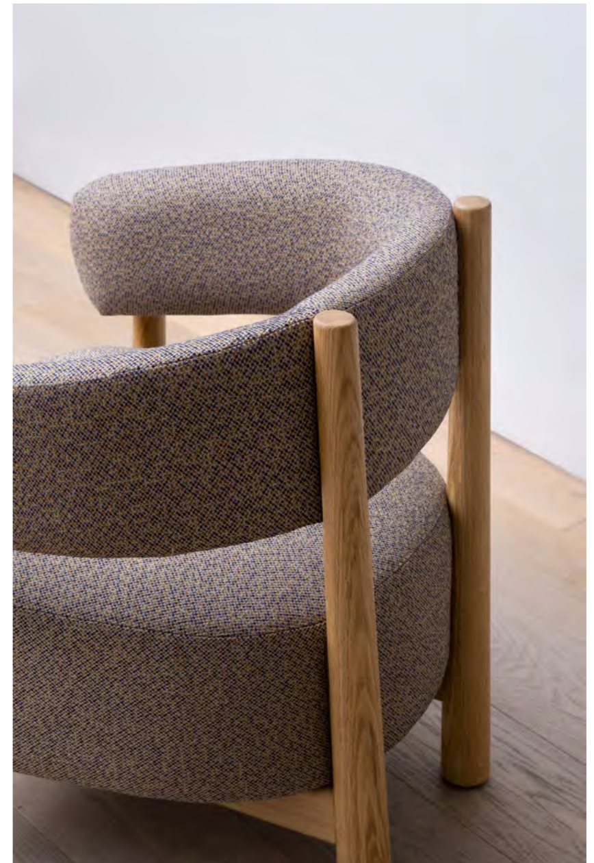
DALYA - PA21 By Patricia Urquiola 2023