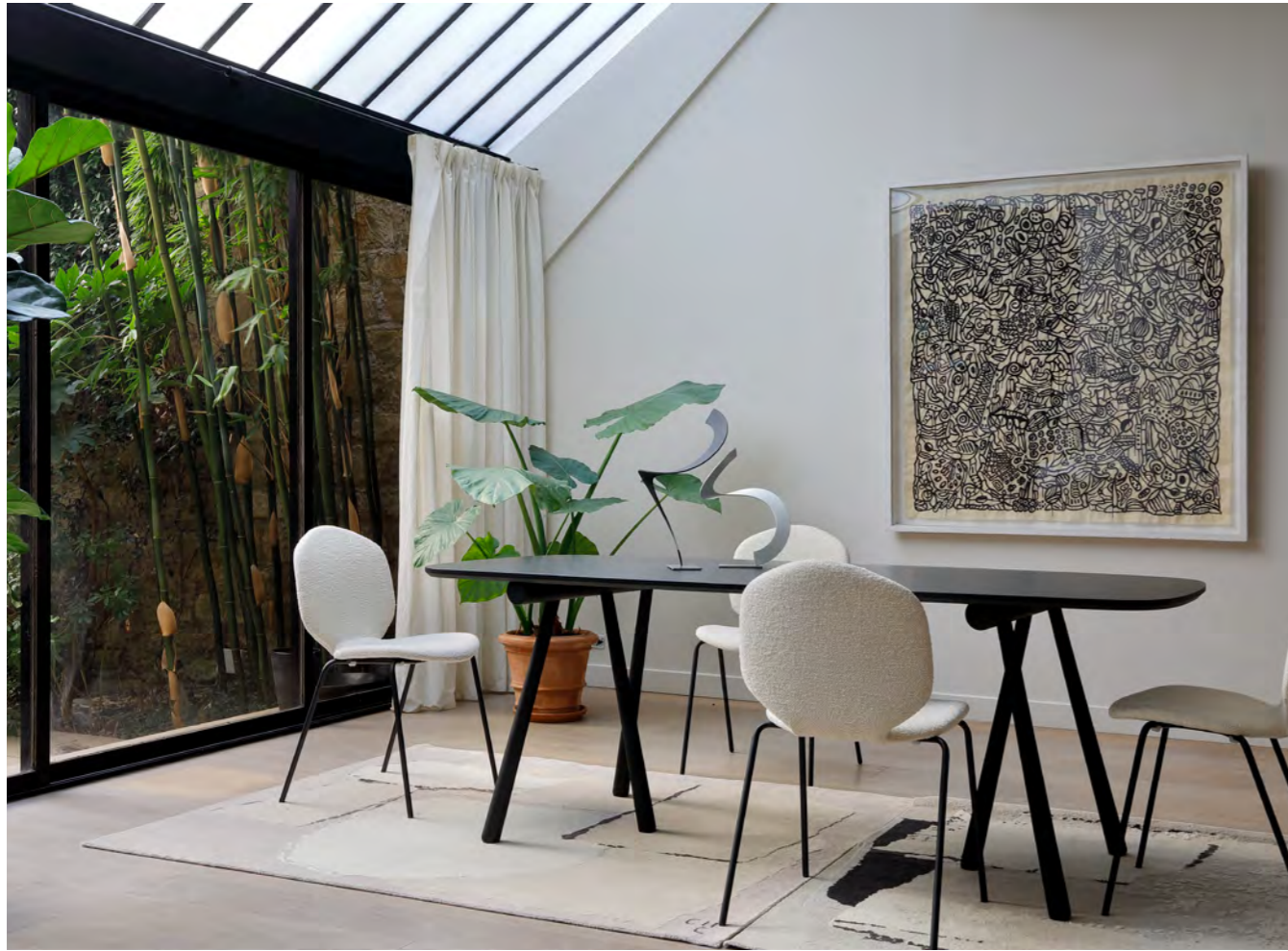
ALTAY - PA7 By Patricia Urquiola 2016