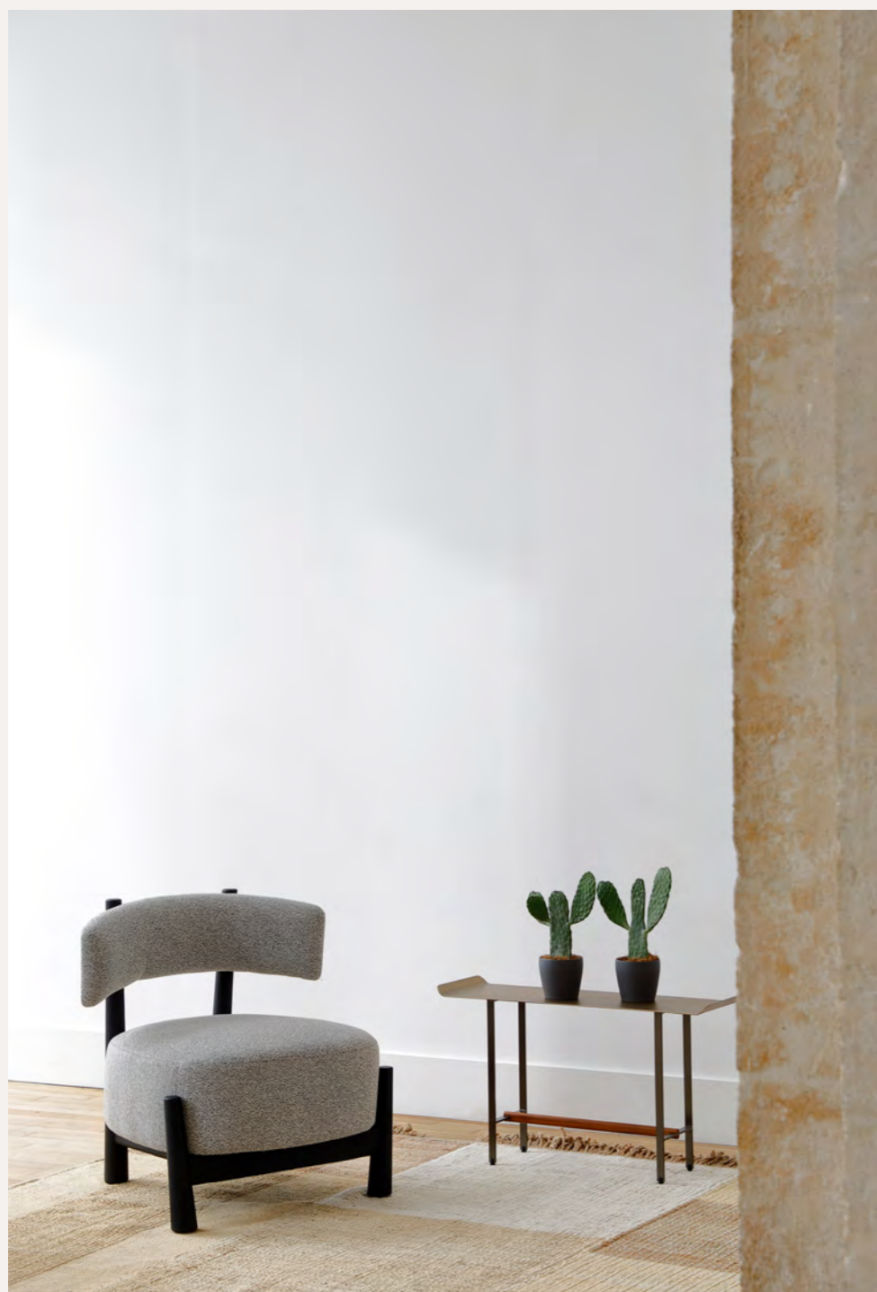
DALYA - PA18 By Patricia Urquiola 2020/2021

Iconic architect, Patricia Urquiola has created a new small Lounge armchair, Dalya, with solid wood legs and a seat and back in polyurethane foam, consisting of different densities and covered with fabric. Comfortable with a generous seat, it is suitable for a home or a professional environment. En 2022, the collection is complete with a chair and a bridge.