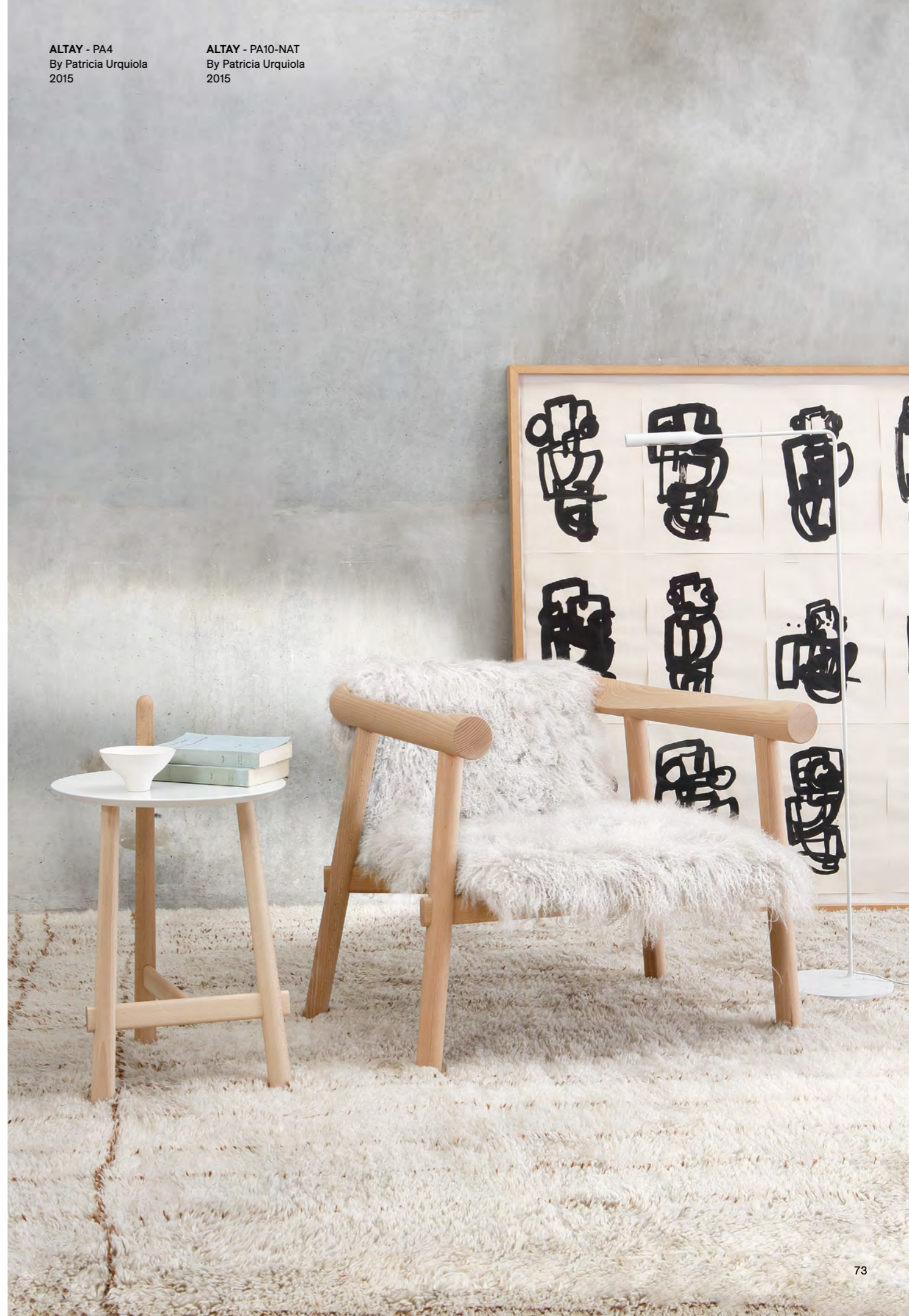
ALTAY - PA10-NAT By Patricia Urquiola 2015