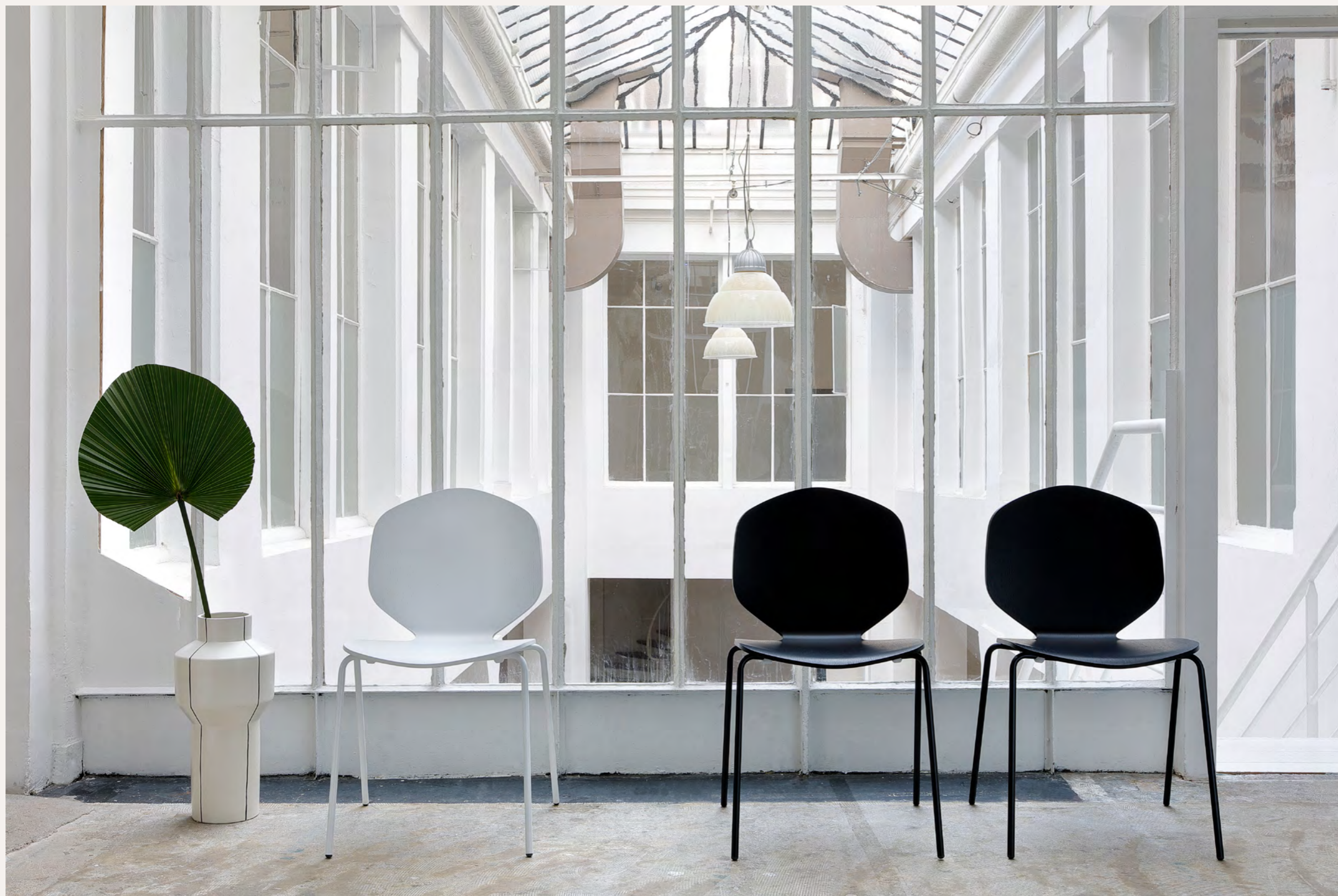
LOULOU - DA4 By Shin Azumi 2018

La Loulou is a chair in natural oak veneer or black stained. It also exists in upholstered version. These 2 collections are adapted to housing and public places: Cafes, restaurants, head offices, media libraries, conference rooms.