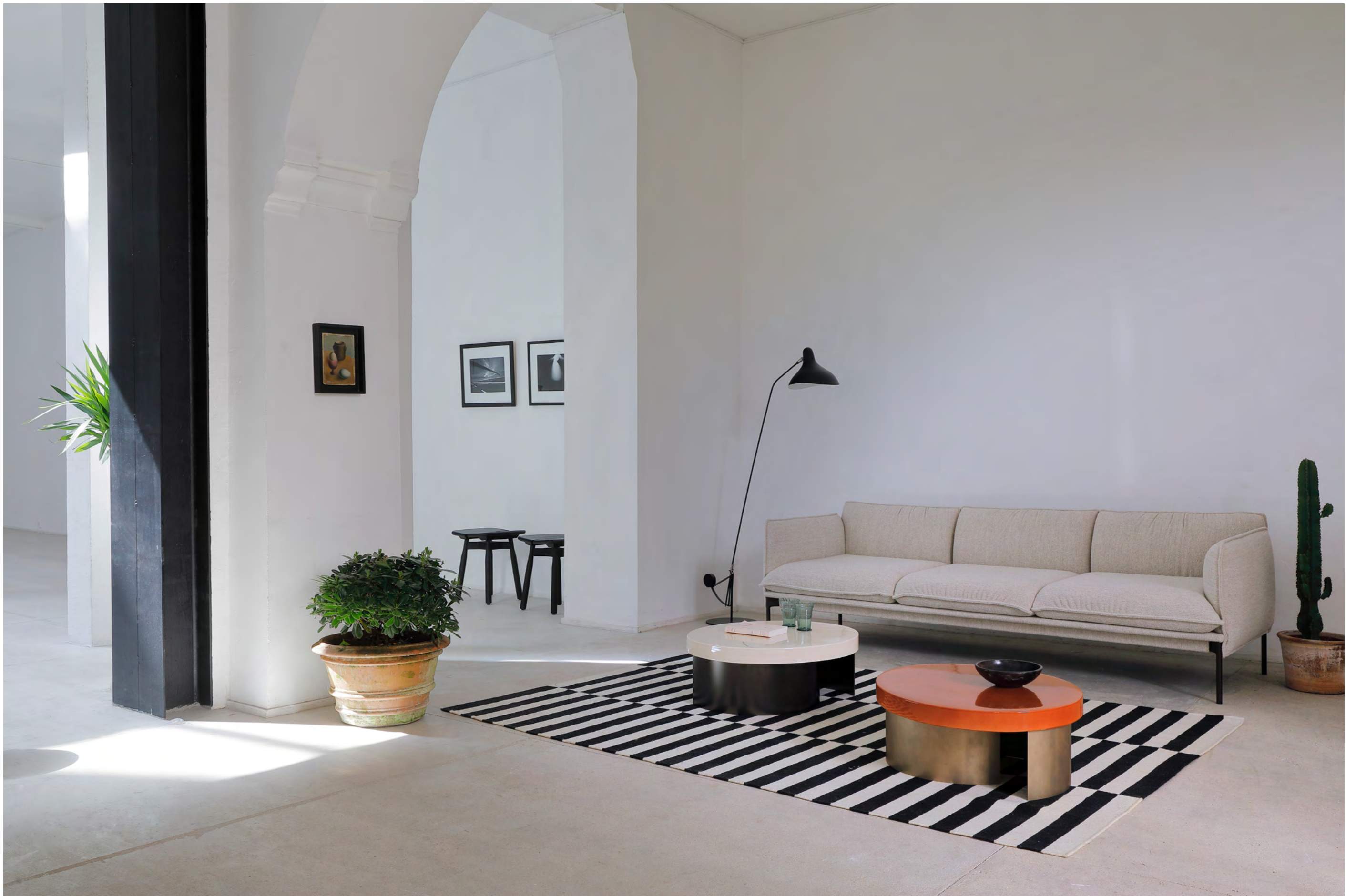
DOM - ZA5 By Marco Zanuso Jr. 2019