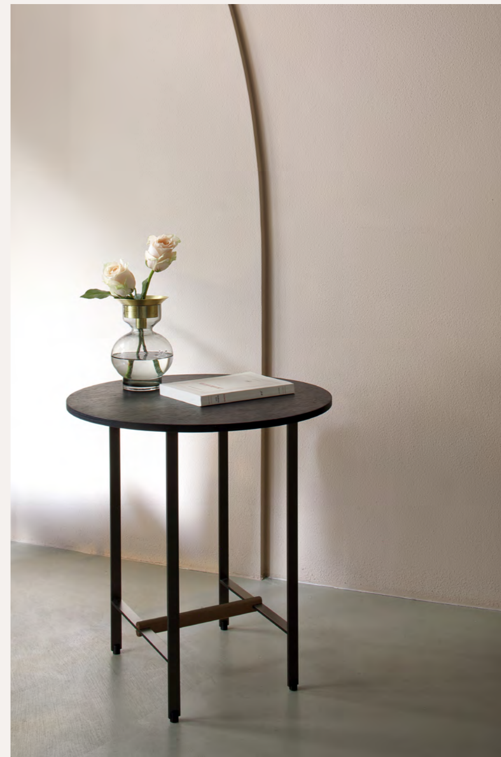
SISTERS - PA15 By Patricia Urquiola 2019

The Sisters collection by Patricia Urquiola is a light, sober and elegant collection, with a series of composable tables in bronze lacquered metal with top in patinated metal or black oak or walnut veneer. A console with the same finish completes the collection.