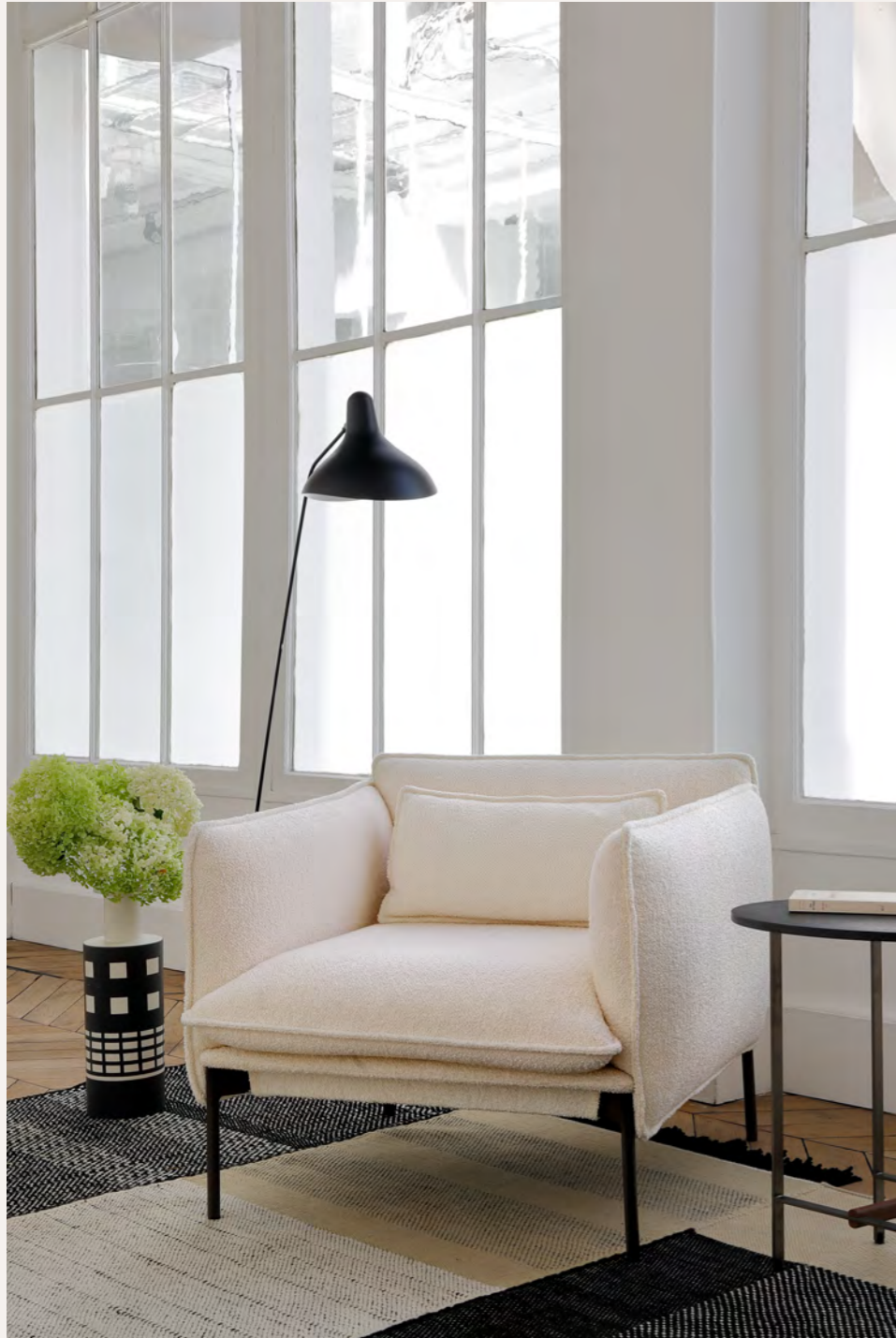
PALM SPRINGS - AV1 By Anderssen & Voll 2020/2021

Espen and Torbjørn have developed a line of Palm Springs sofas, two and three seaters, along with an armchair and ottoman. The base is in lacquered metal, the seats in polyurethane foam of varying density. They are elegant, comfortable and functional.