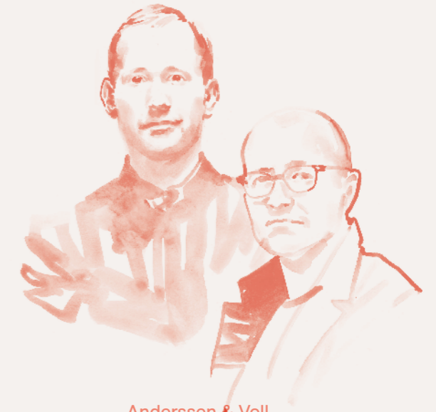
Anderssen & Voll