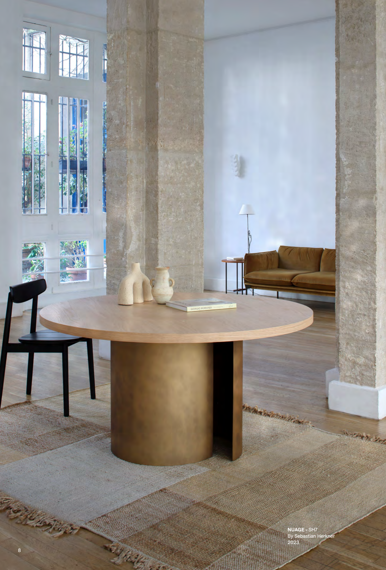
NUAGE - SH7 By Sebastian Herkner 2023

The particular success of the “Nuage” collection, created by the brilliant designer Sebastian Herkner: coffee tables in metal structure, patinated brass color, or bronze, and ceramic top in different colors, has encouraged him to develop an elegant, sophisticated dining table, with a round natural top, in oak veneer.