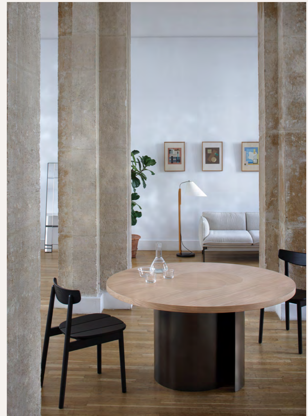
NUAGE - SH77 By Sebastian Herkner 2023