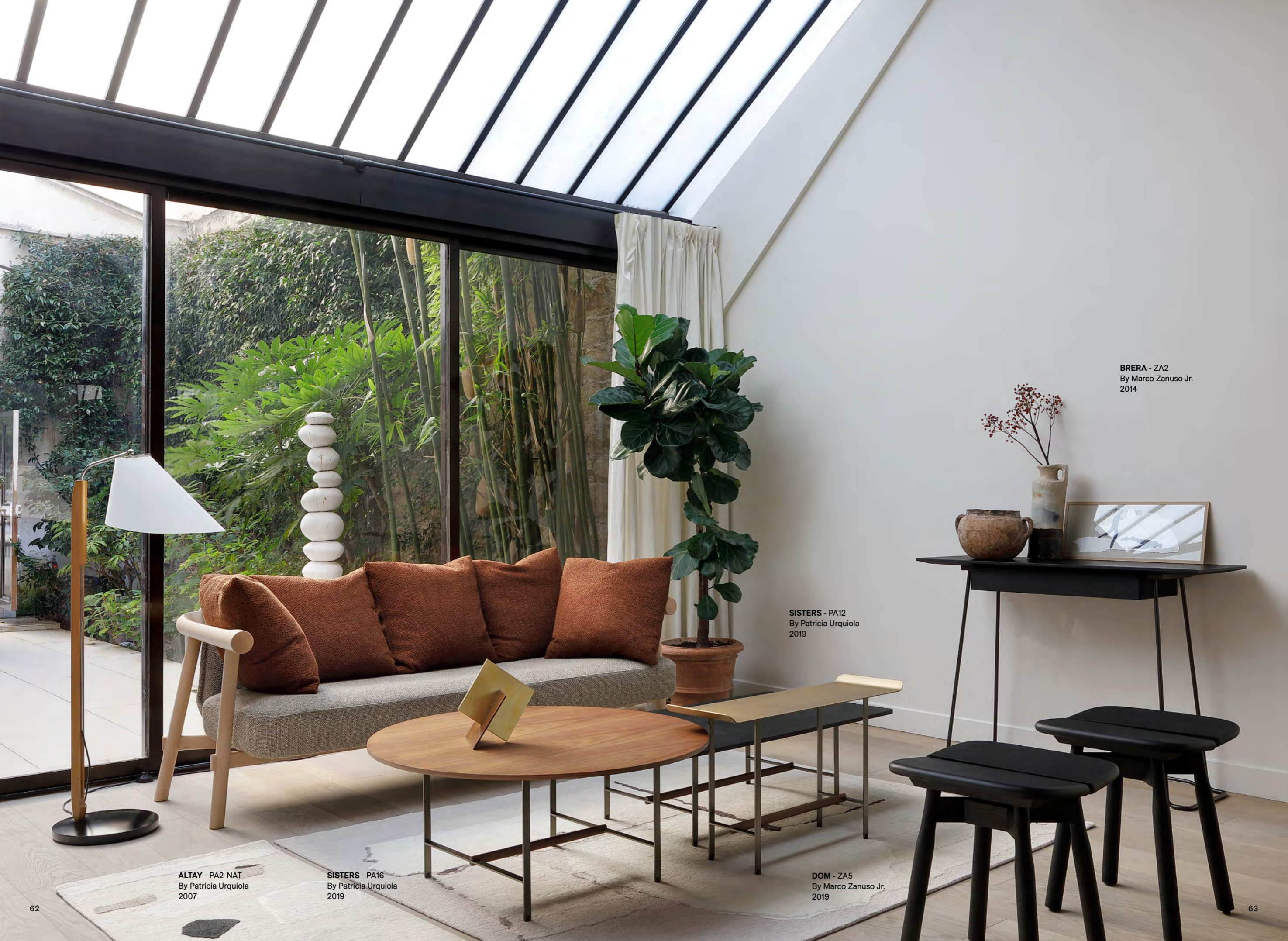
BRERA - ZA2 By Marco Zanuso Jr. 2014