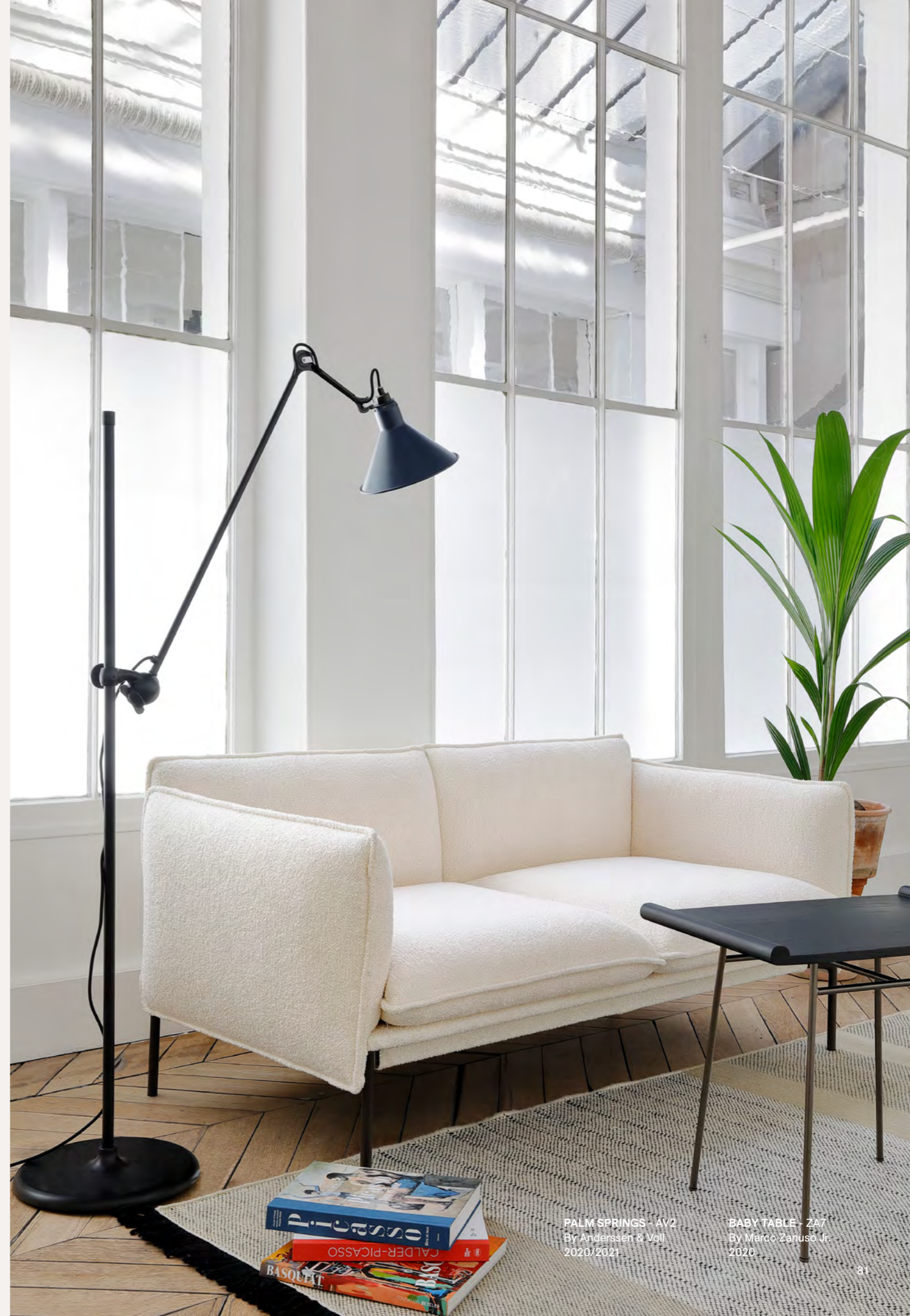
PALM SPRINGS - AV2 By Anderssen & Voll 2020/2021