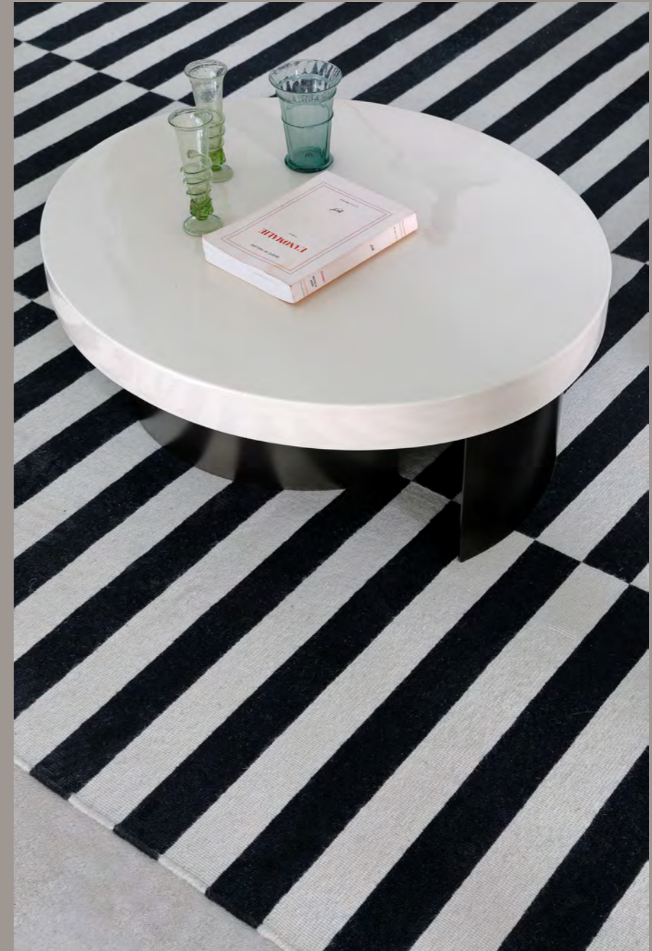
NUAGE - SH7 By Sebastian Herkner 2022