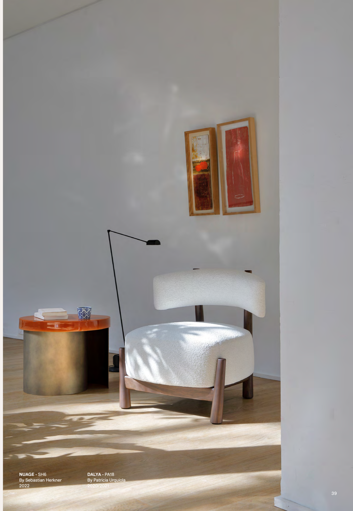
NUAGE - SH6 By Sebastian Herkner 2022