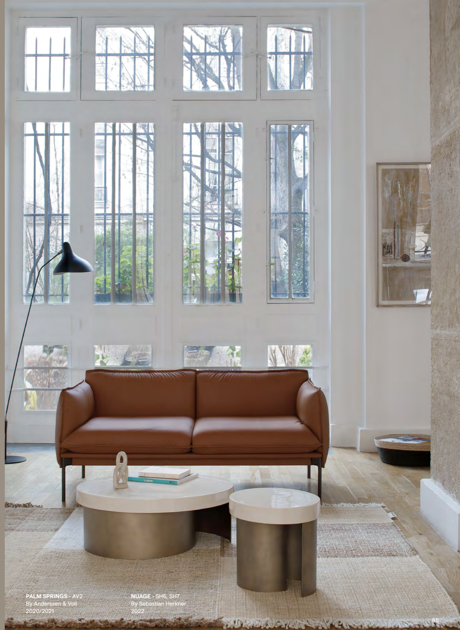
PALM SPRINGS - AV2 By Anderssen & Voll 2020/2021