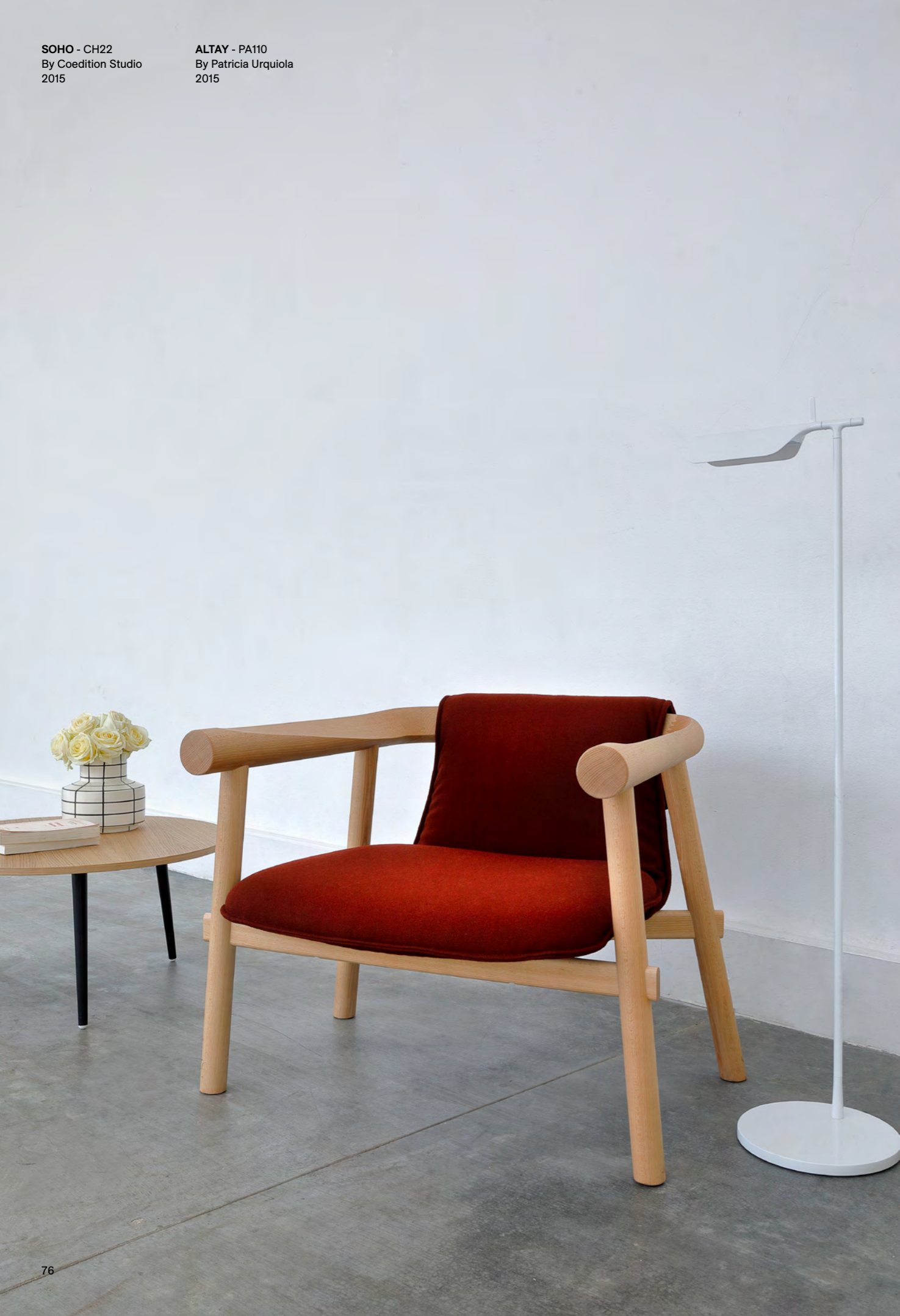
ALTAY - PA110 By Patricia Urquiola 2015