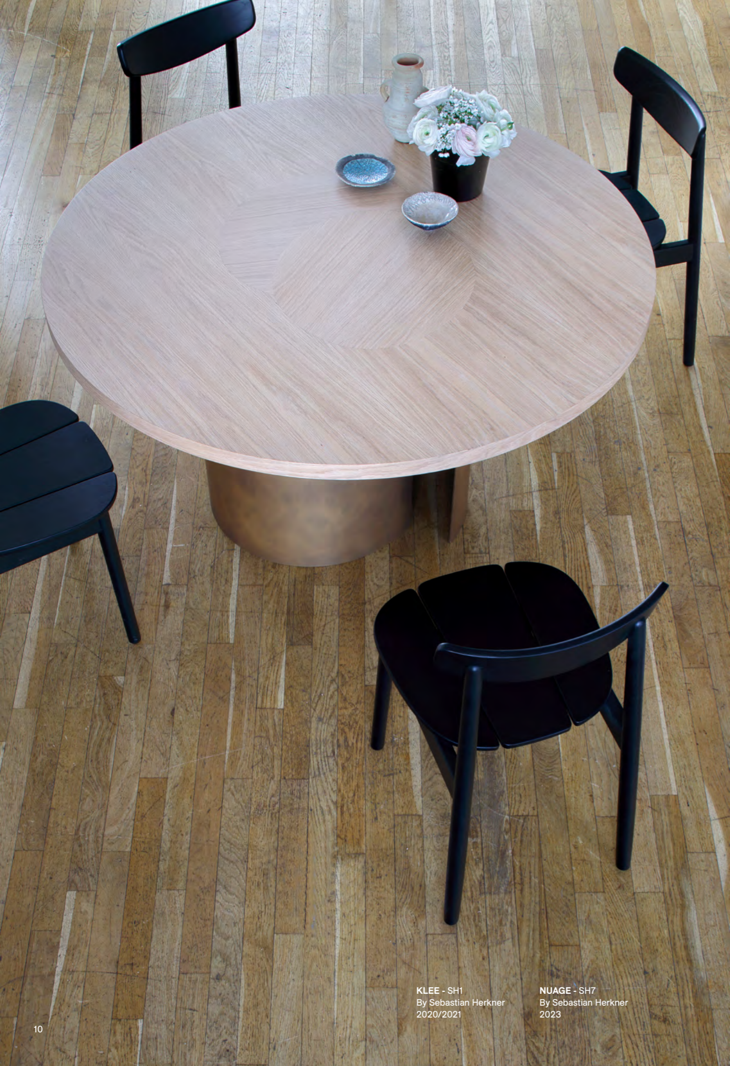
KLEE - SH1 By Sebastian Herkner 2020/2021