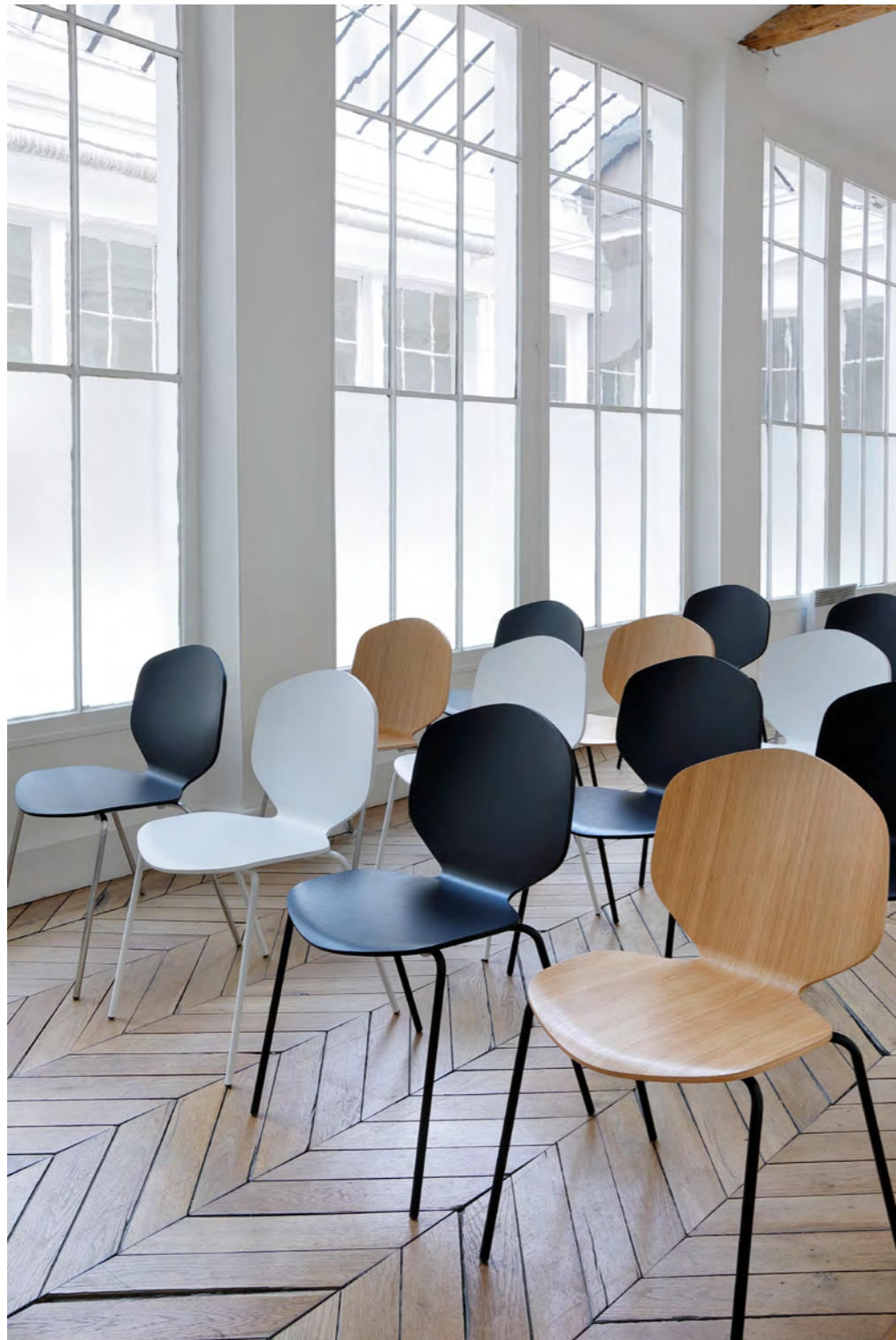
LOULOU - DA4 By Shin Azumi 2018