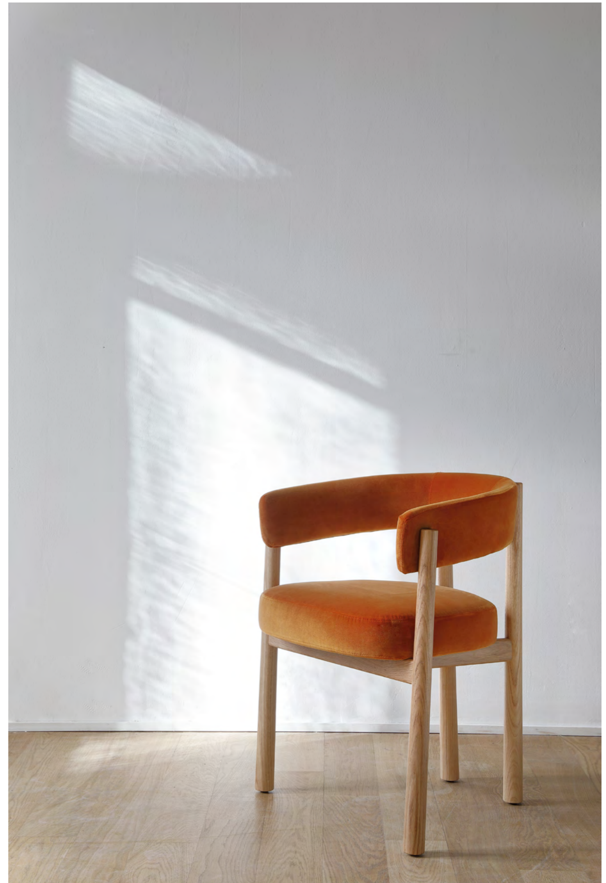
DALYA - PA20 By Patricia Urquiola 2022