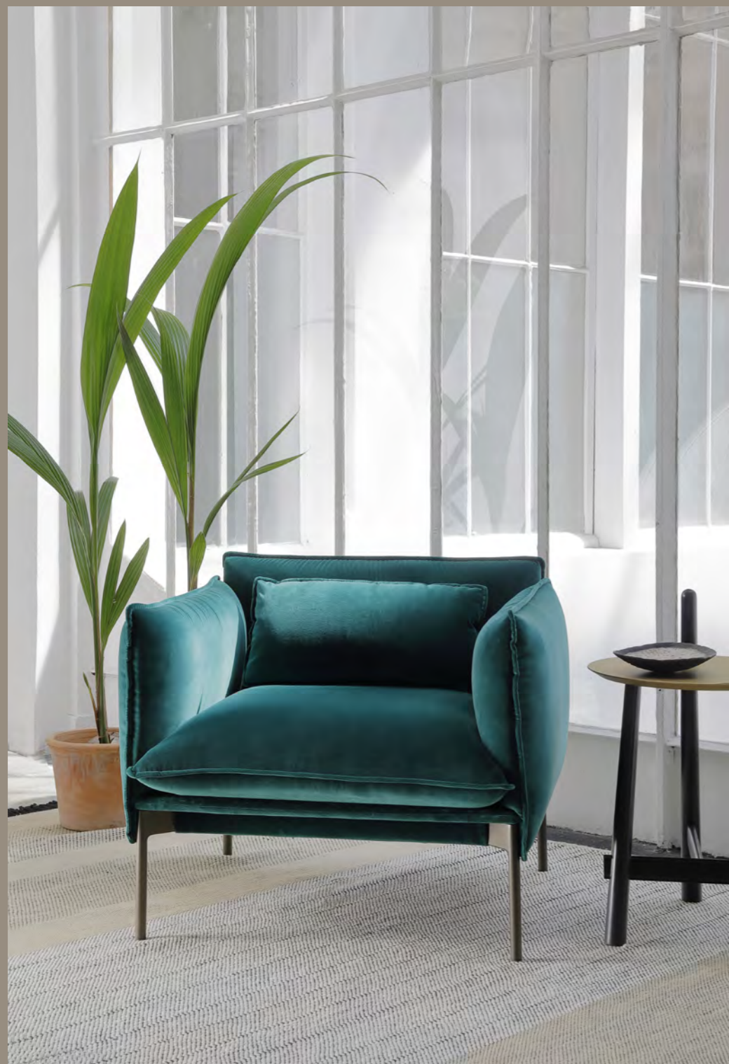
PALM SPRINGS - AV1 By Anderssen & Voll 2020/2021