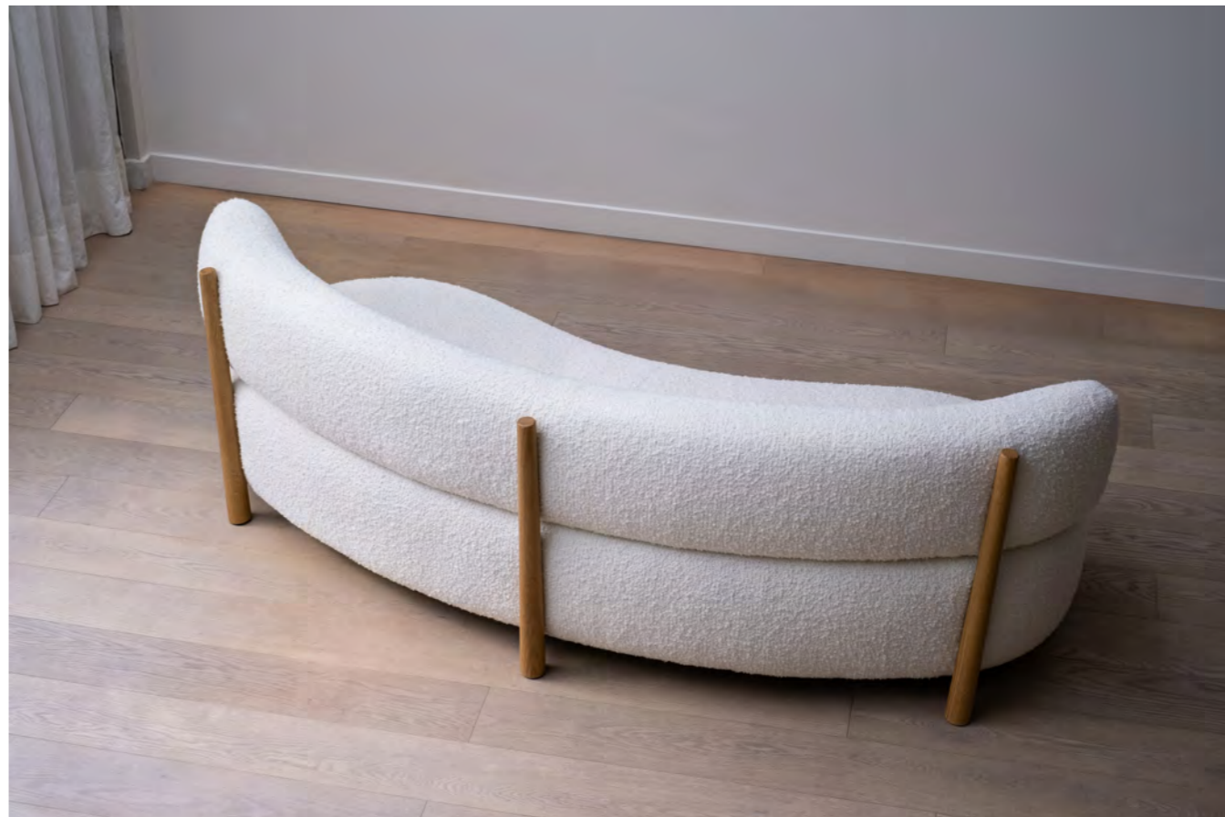
DALYA - PA22 By Patricia Urquiola 2023