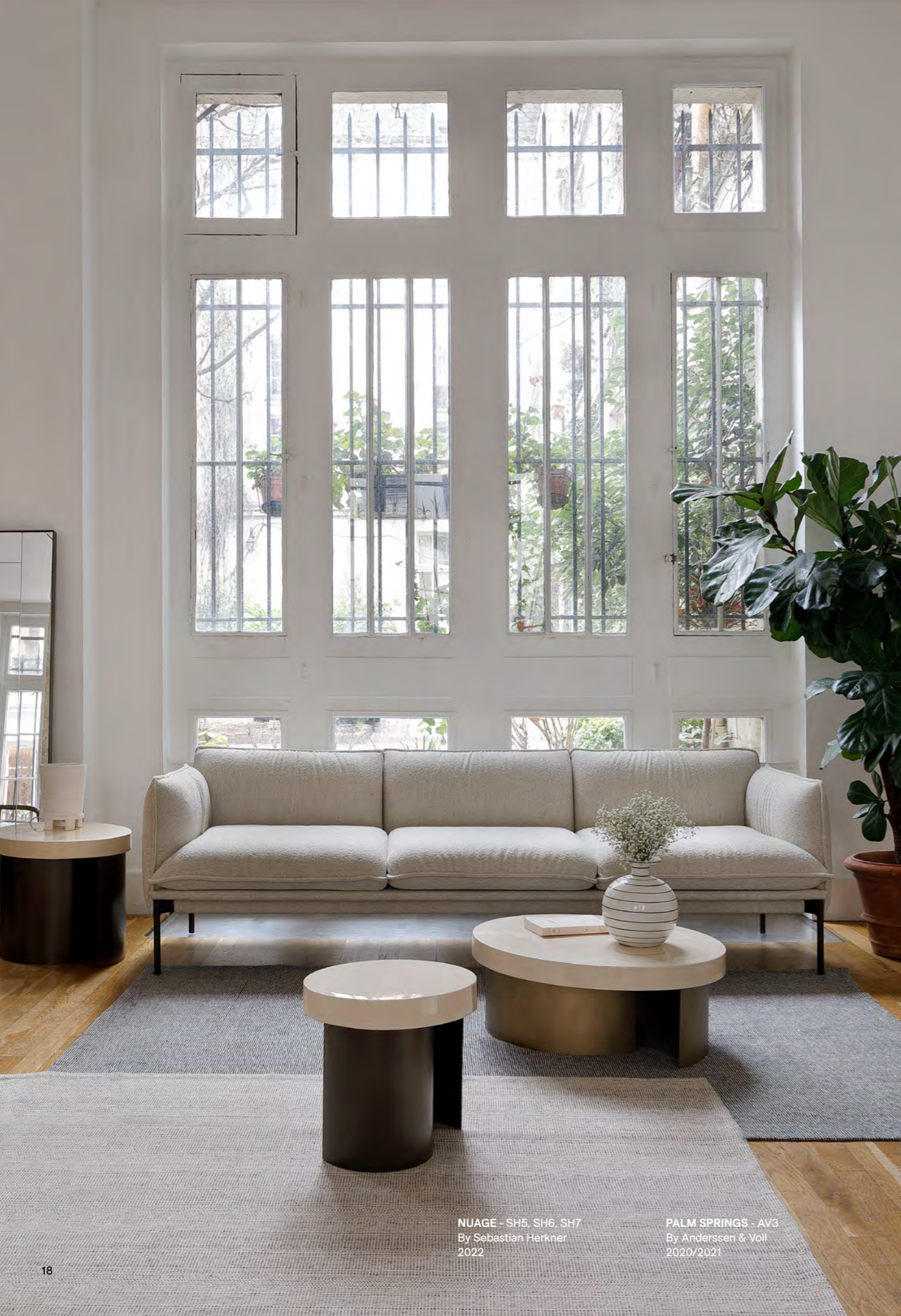
NUAGE - SH5, SH6, SH7 By Sebastian Herkner 2022