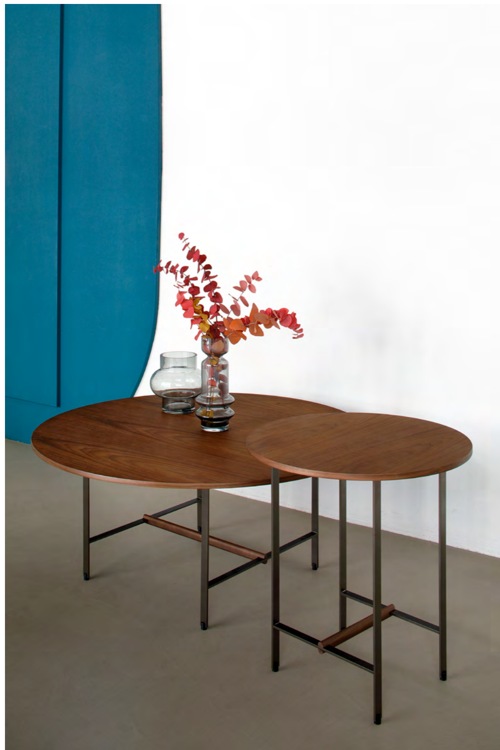
SISTERS - PA16 By Patricia Urquiola 2019