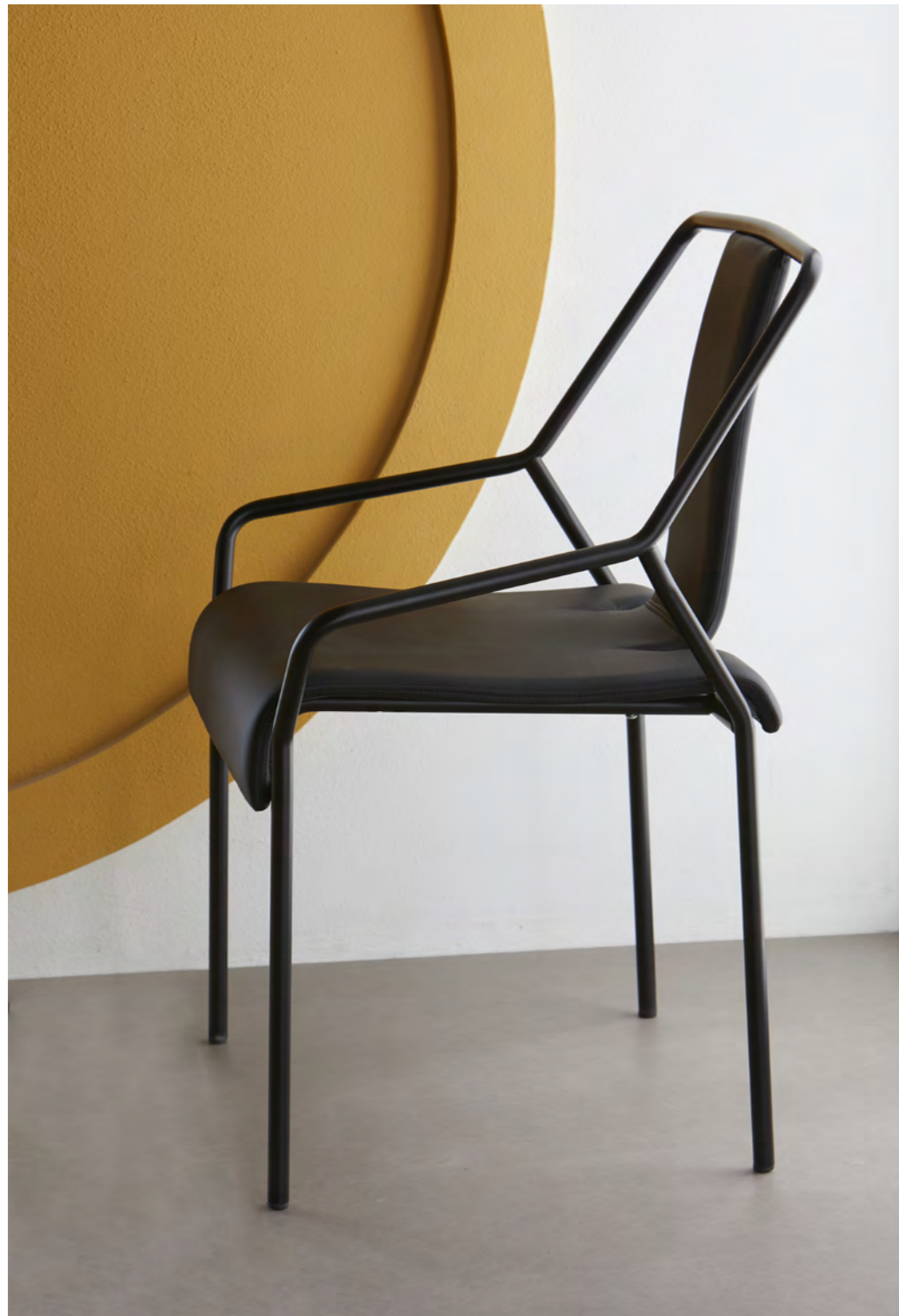
DAO - DA5 By Shin Azumi 2018