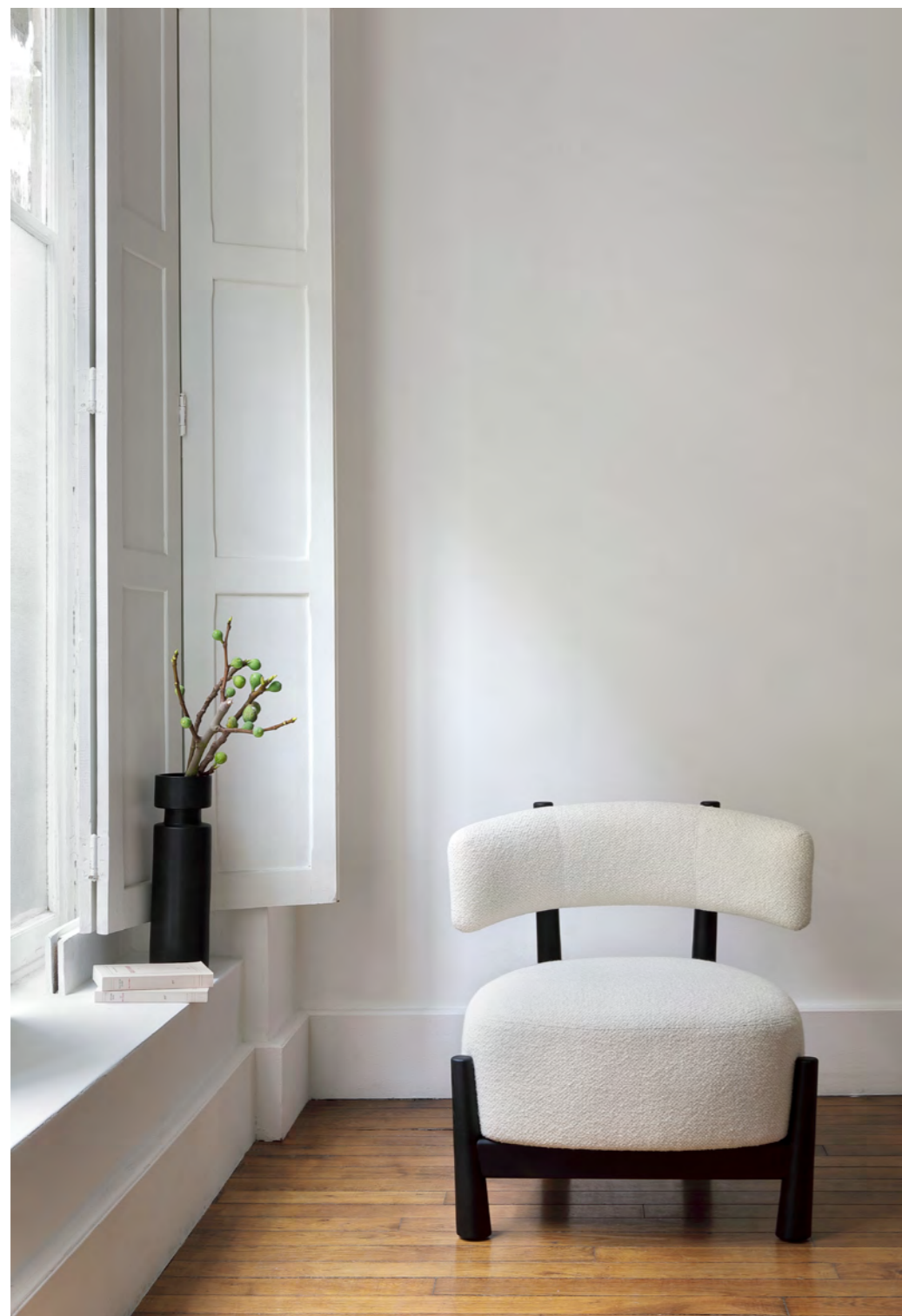
DALYA - PA18 By Patricia Urquiola 2020/2021