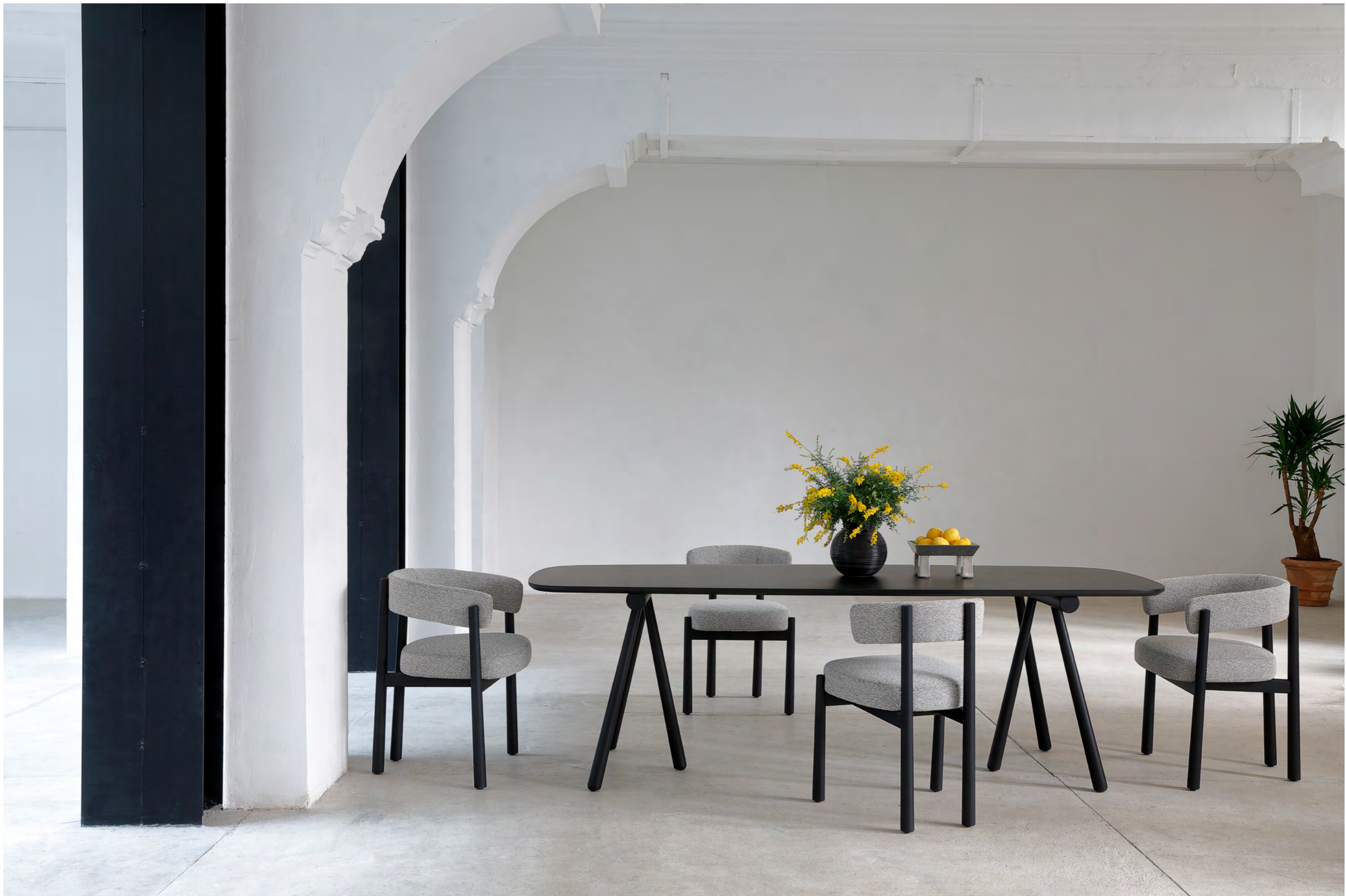
ALTAY - PA7 By Patricia Urquiola 2016