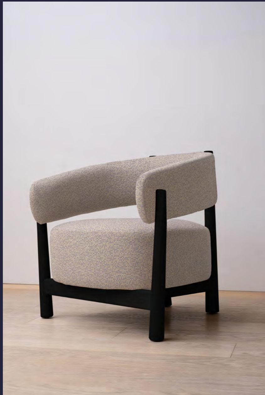
DALYA - PA221 By Patricia Urquiola 2023