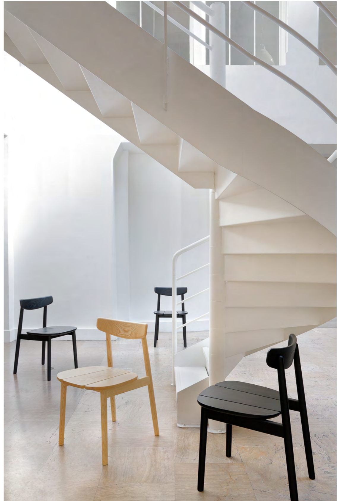
KLEE - SH1 By Sebastian Herkner 2020/2021