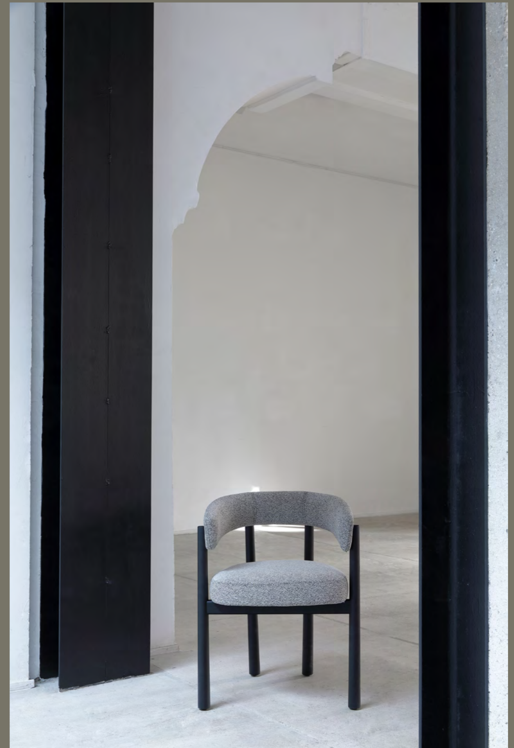
DALYA - PA19 By Patricia Urquiola 2022