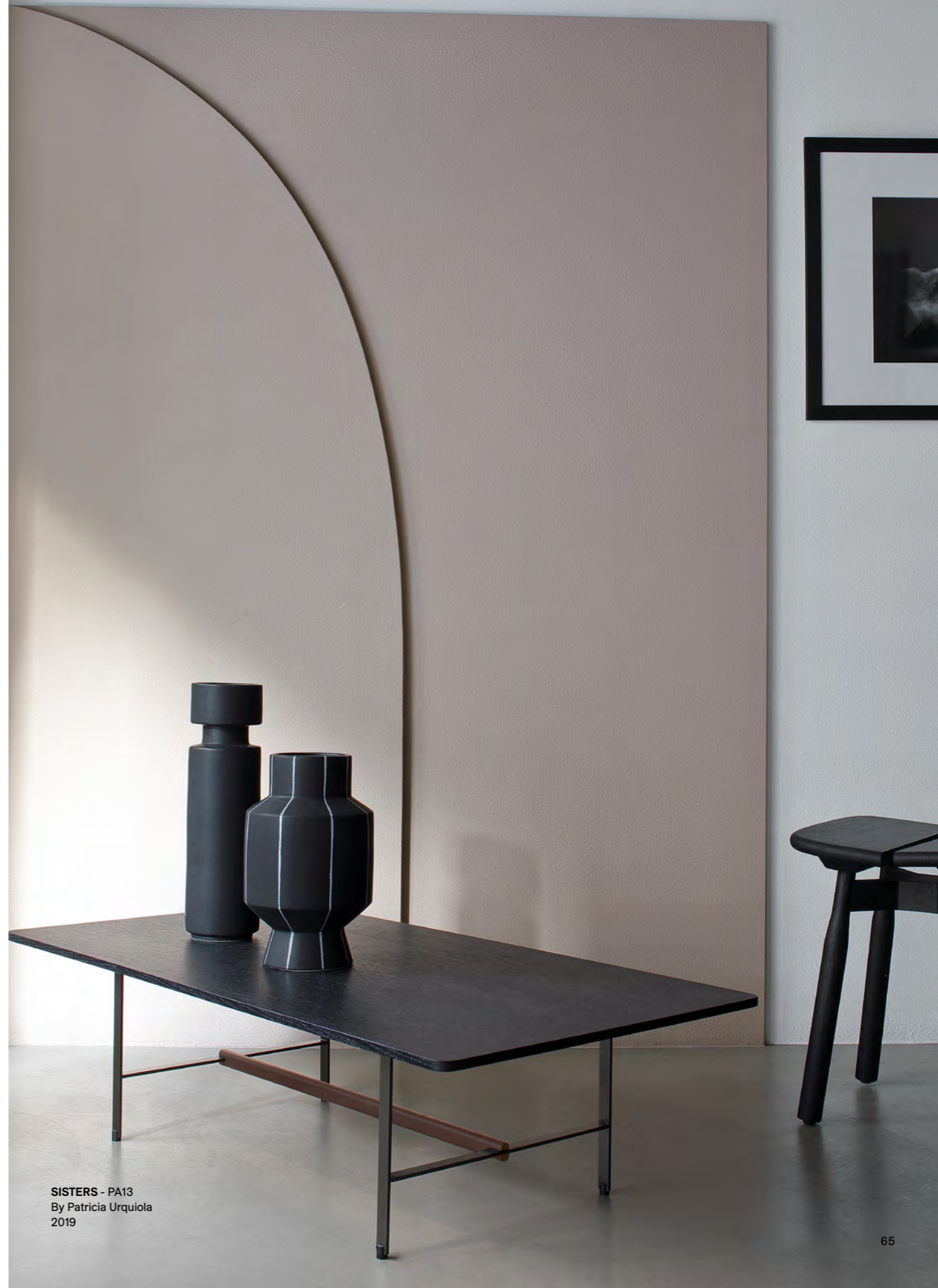
SISTERS - PA13 By Patricia Urquiola 2019