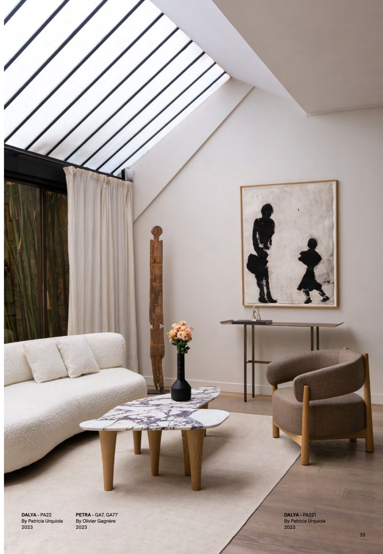
DALYA - PA22 By Patricia Urquiola 2023