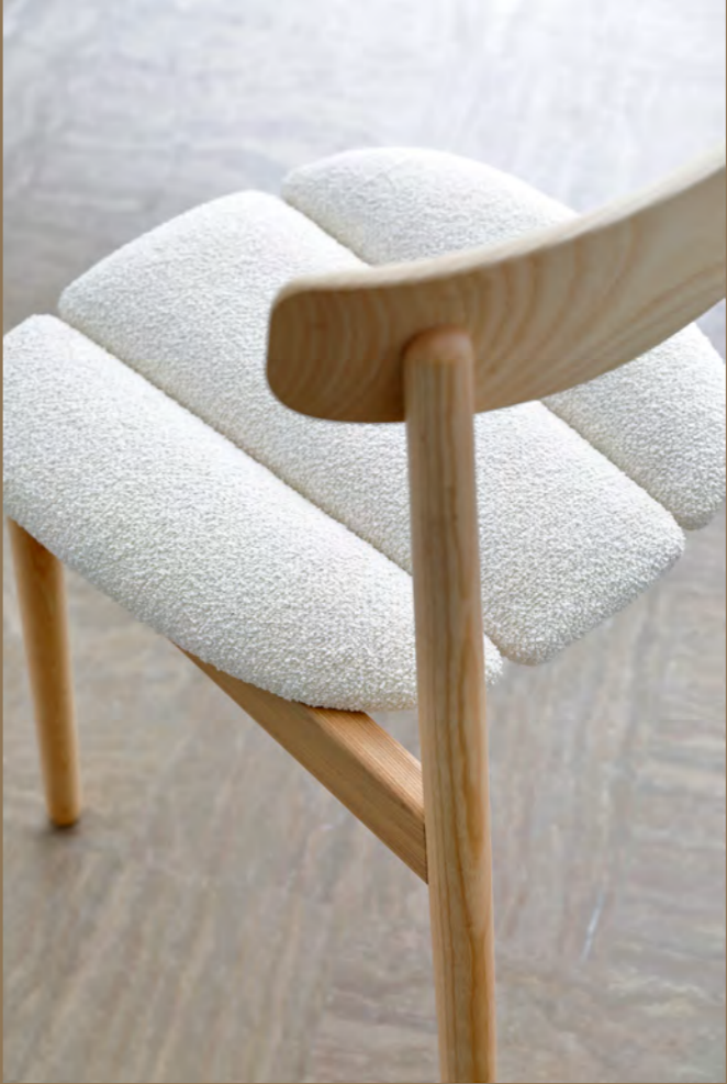
KLEE - SH22 By Sebastian Herkner 2020/2021