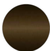
Bronze noir Black bronze