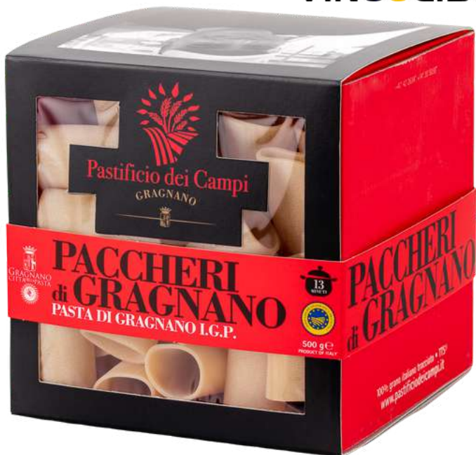
Paccheri di Gragnano I.G.P. - 500gr