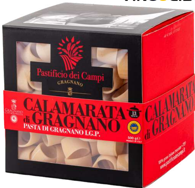
Calamarata di Gragnano I.G.P. - 500gr

Calamarata pasta di Gragnano I.G.P. - 500gr