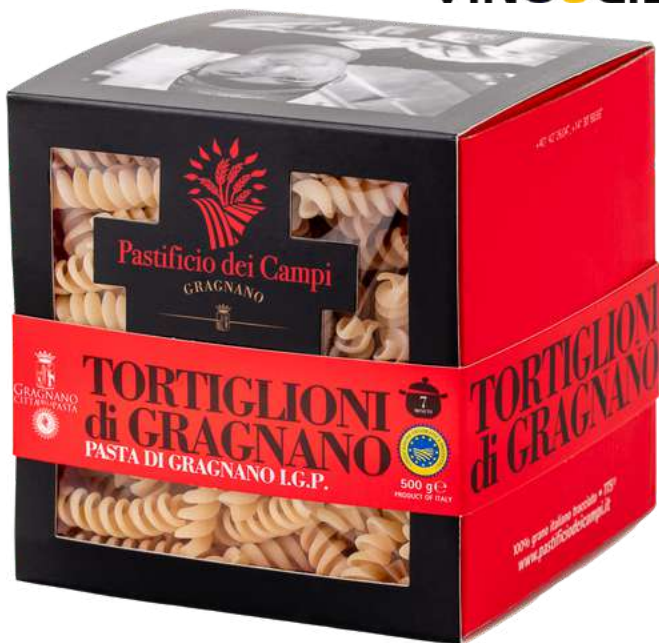
Tortiglioni di Gragnano I.G.P. - 500gr

Tortiglioni pasta di Gragnano I.G.P. - 500gr