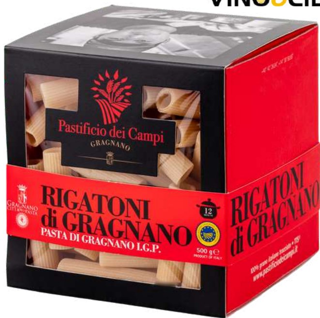
Rigatoni di Gragnano I.G.P. - 500gr