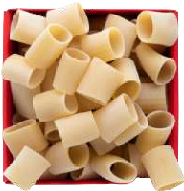
Mezzi paccheri di Gragnano I.G.P. - 500gr

Mezzi paccheri pasta di Gragnano I.G.P. - 500gr