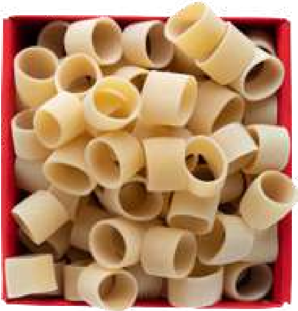
Calamarata di Gagnano I.G.P. - 500gr

Calamarata pasta di Gagnano I.G.P. - 500gr