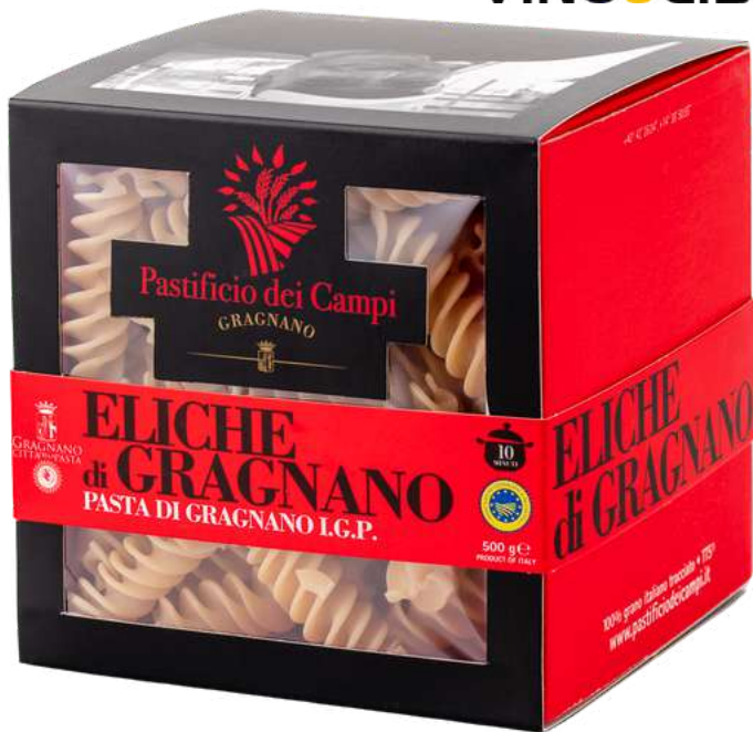
Eliche di Gragnano I.G.P. - 500gr