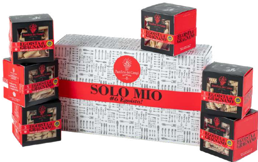
KIT Solo Mio - 6 Egoista - GIFT BOX