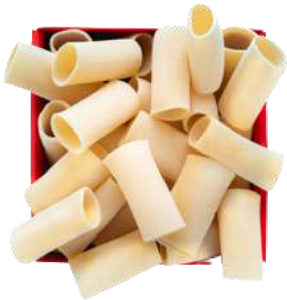
Paccheri di Gragnano I.G.P. - 500gr

Paccheri pasta di Gragnano I.G.P. - 500gr