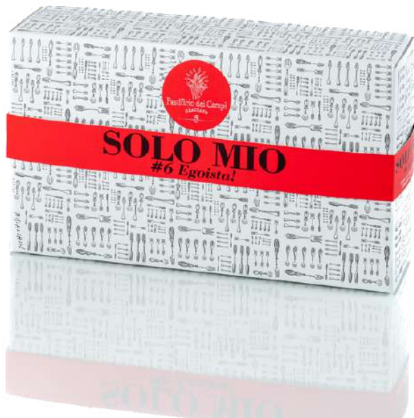
KIT Solo Mio - 6 Egoista - GIFT BOX