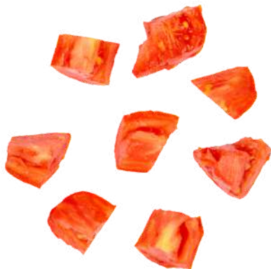
POLPA DI POMODORO - 400gr