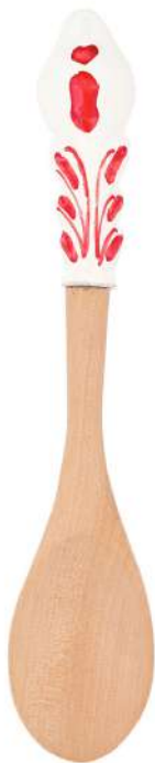
Cucchiaio di legno in ceramica