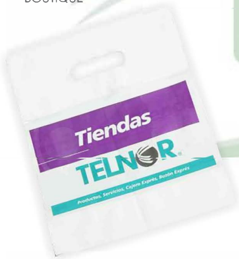
BOLSA TIPO BOUTIQUE