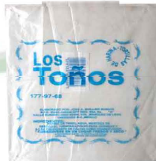
BOLSA PARA TORTILA