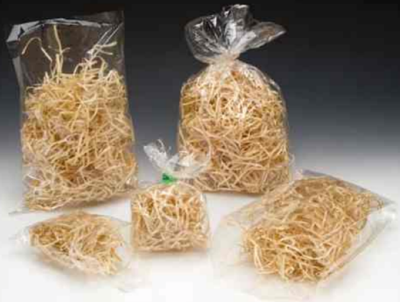
Venta por Kilogramo