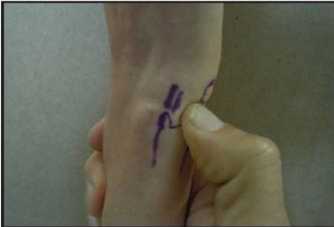
Figure 4. The ulnar snuff box

Precios de XERENDIP-SOMATROPINA. A continuación le presentamos precios de referencia, precio estimado, precios de lista o precios solicitados por compradores de XERENDIP-SOMATROPINA. Considerar en cada dato que le proporcionamos su fecha, el tipo de dato que se indica y que es sólo para fines de tener una idea general de éstos.