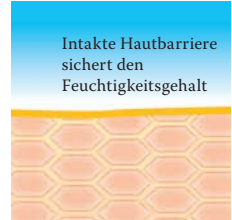
Intakte, schützende Hautbarriere mit Linol-säure-reichen Lipiden

Weitere Informationen stehen für Sie bereit unter www.linola.de