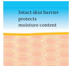
Intact protective skin barrier with lipids rich in linoleic acids.

Further information can be found at www.linola.com