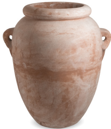
Anfora con Manici