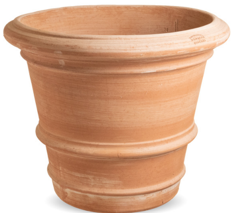
Conca Classico Toscana

Conca Classico Toscana eller Vaso Toscana har den klassiske koniske form med 2-3 dekorative ringe som er afsluttet med en smukt formet kant foroven.