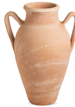
Anfora liscia 2 Manici