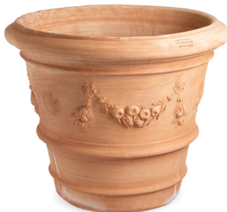
Conca con Festone

Dette design bruges til alle typer planter, buske og træer.