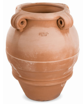
Orcio 4 Riccibucati