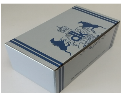
専用箱 プラケース10ケース入