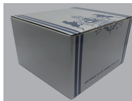
専用箱 プラケース10ケース入