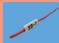
⑤マックル ずれにくい