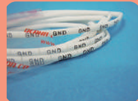
④エコマークチューブ エコ対応