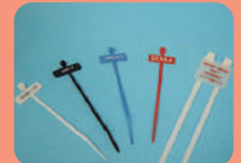
⑥表示バンド 結束バンドタイプ