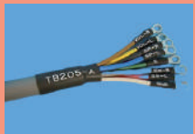
①シューマー ボルト・段差部分に