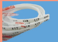
③マークチューブ ノーマルタイプ