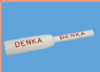
②エコシューマー エコ対応