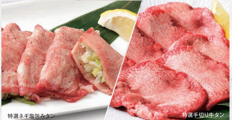
特選ネギ塩包みタン