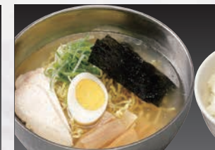
こだわりスープがたまらない特製ラーメン! ▶ハーフラーメンセット (正油or塩ラーメン・小ライス)