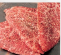
▶和牛モモ(40g) 旨みたっぷりの赤身!