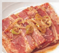
▶カルビ(40g) 金剛園人気No.1!