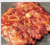
▶サガリ(40g) 特製タレがやみつきに!