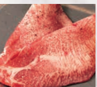
▶上タン塩(2枚) ヘルシー、女性に人気!