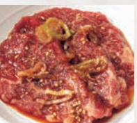
▶牛ロース(40g) 熟成した生肉が旨い!