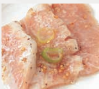
▶トントロ(40g) 豚のほっぺ、濃厚な旨さ!