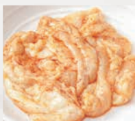
▶豚味噌ホルモン(40g) ホルモン人気No.1!