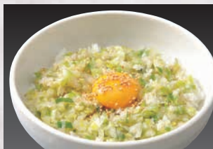
味付きネギと卵黄のまるやかさがマッチ! ▶ねぎたまご飯セット (ねぎたまご飯・スープ)