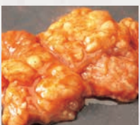
▶牛ホルモン(40g) 人気の濃厚牛ホルモン!