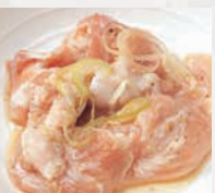
▶鶏カルビ(40g) 鮮度に自信!