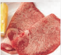
▶上タン塩(2枚) ヘルシー、女性に人気!