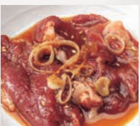
▶ジンギスカン(40g) 北海道といえば、コレ!