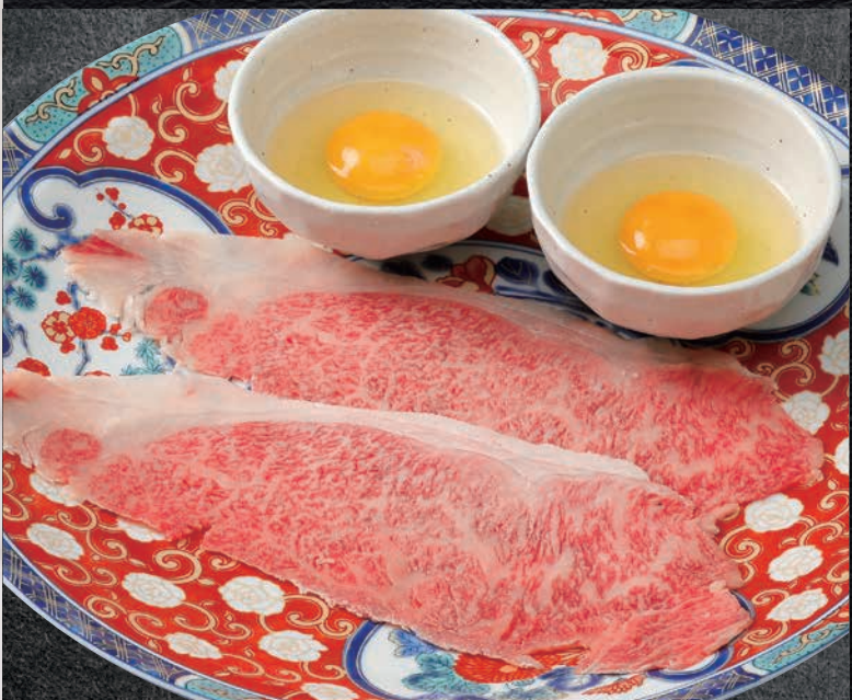
和牛しゃぶサーロイン ※写真は2人前です。