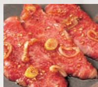
▶和牛カルビ(40g) 和牛人気No.1!