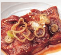
▶ハラミ(40g) 特製タレがやみつきに!