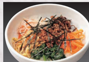
自家製ナムルとごま油が食欲をそそる! ▶ビビンバセット (ビビンバ・スープ)