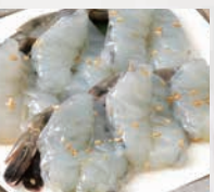
▶海老(40g) プリプリの美味しさ!