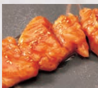
▶上ミノ(40g) コロコロ食感がクセになる!