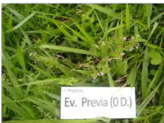
Escobilla rosada ( Melochia pipramidata ) previo aplicación de TOMAHAWK 200 EC ® + SULFON ®