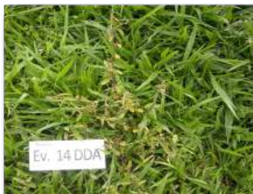
Escobilla ( Sida rhombifolia ) a los 14 días de aplicación de TOMAHAWK 200 EC