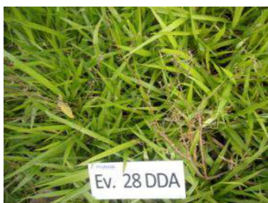
Escobilla ( Sida rhombifolia ) a los 28 días de la aplicación de TOMAHAWK 200 EC ®

Se puede usar solo o en combinación con otros herbicidas, que permite amplio margen de control herbicidas de distinto modo de acción en el control de malezas leñosas que toleran herbicidas (Imágenes 4 - 8).