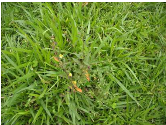
Escobilla ( Sida rhombifolia ) antes de la aplicación de TOMAHAWK 200 EC ®

Debido a su acción a nivel de los meristemos, TOMAHAWK 200 EC provee máximo control cuando se lo aplica a plantas en activo crecimiento (Imágenes 1-8).