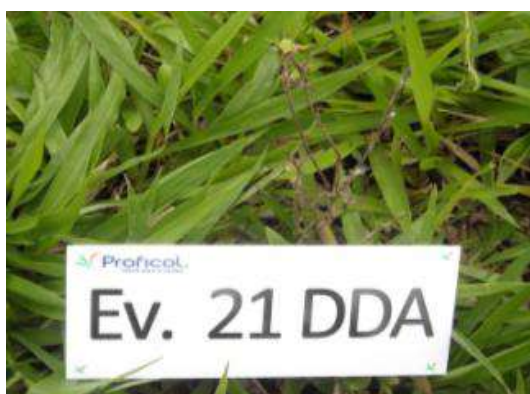
Escobilla rosada ( Melochia pipramidata ) a los 21 días de la aplicación de TOMAHAWK 200 EC + SULFON