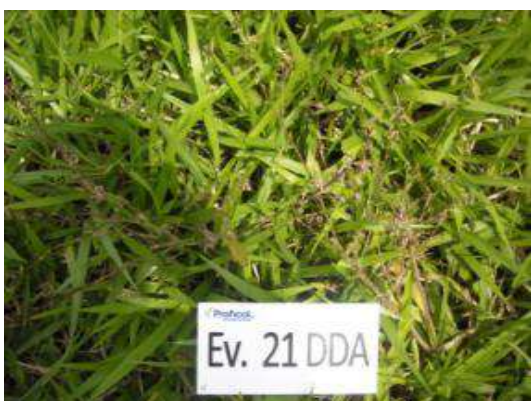
Escobilla ( Sida rhombifolia ) a los 21 días de la aplicación de TOMAHAWK 200 EC ®