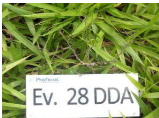
Escobilla rosada ( Melochia pipramidata ) a los 28 días de la aplicación de TOMAHAWK 200 EC + SULFON

El efecto fitotóxico ocasionado por TOMAHAWK 200 EC ® es muy activo para el control de perennes en las malezas susceptibles leñosas de hoja ancha, se mostró inicialmente como una clorosis ligera en las hojas, la cual aumenta progresivamente hasta llegar a una necrosis parcial o total del follaje.