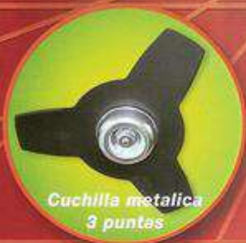
Cuchilla metálica 3 puntas