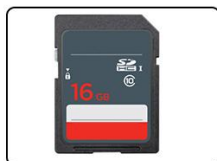
⑨Carte SD 16G