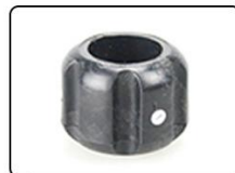
⑦camera protective cover * 1