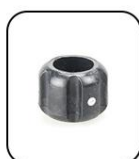
Coque de protection