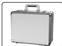
①boîte en aluminium *1