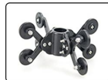
⑧poulie de tuyau * 1