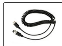
④câble de connexion * 1