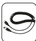
Câble de connexion