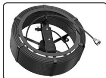
⑤bobine de câble *1