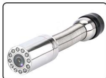
⑥tête de caméra * 1