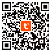
Tuya Smart App