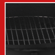
Cooking grate Grillrost