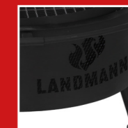
Landmann logo Landmann Schriftzug