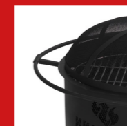
Surrounding carrying rim Umlaufender Tragerand