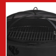
Cover with mesh Funkenschutzgitter