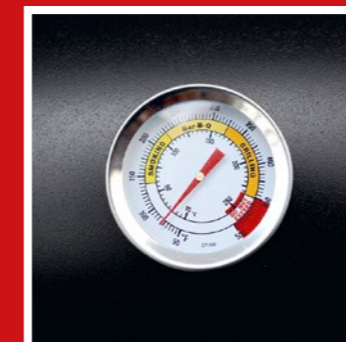
Thermometer in lid Deckelthermometer