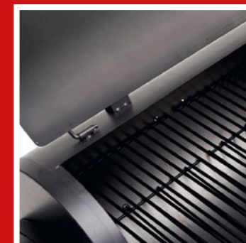
Enamelled grill racks Emaillierte Grillroste