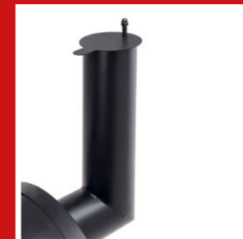
Chimney with rain cover Schornstein mit Regendeckel