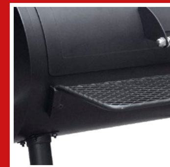
Detachable shelf at front Abnehmbarem Fronttisch