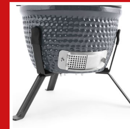
3 legs screwed on firmly for a stable barbecue 3 fest verschraubte Beine für einen sicheren Stand