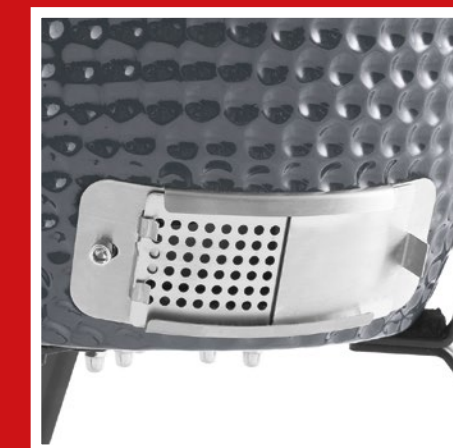
Additional ventilation hatch Zusätzliche Lüftungsklappe