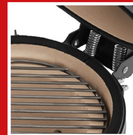
Insulating ceramic wall Isolierende Keramikwand