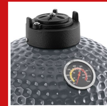
Cast-iron valve in lid & thermometer in lid Gusseisernes Deckelventil & Deckelthermometer