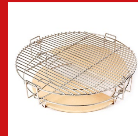
With multi-level grill rack Mit Multi-Level- Grillrost