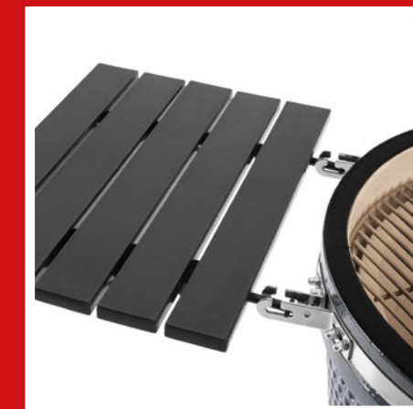
With 2 folding side tables Stabiler Metalltisch