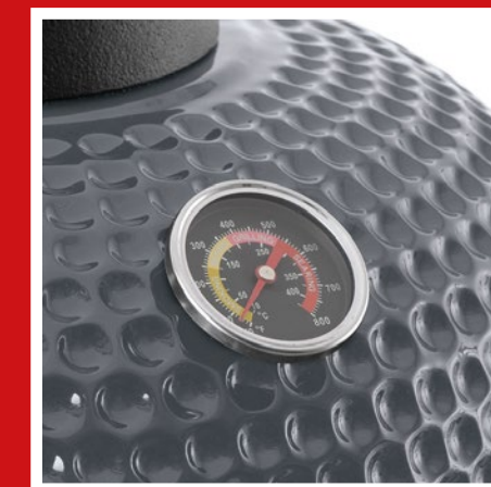
Cast-iron valve in lid & thermometer in lid Gusseisernes Deckelventil & Deckelthermometer