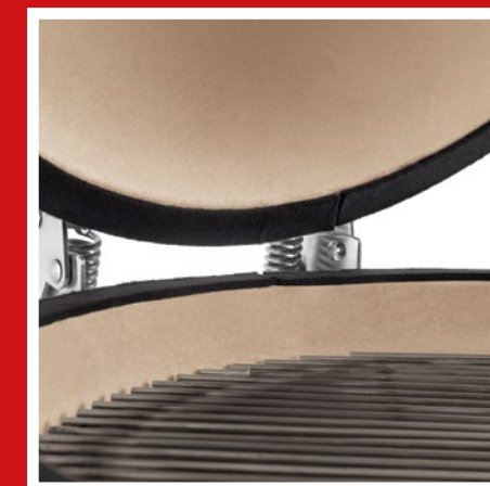
Insulating ceramic wall Isolierende Keramikwand