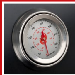
Thermometer in lid Deckelthermometer