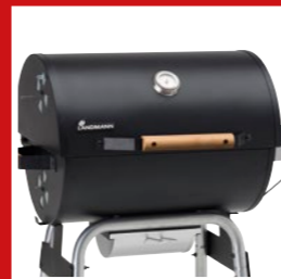
Tried-and-tested barrel barbecue Bewährtes Prinzip Barrelgrill