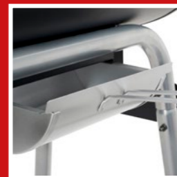
Ash catcher Ascheauffangschale