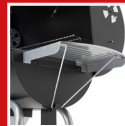
Stable & folding side table Stabiler & abklappbarer Seitentisch